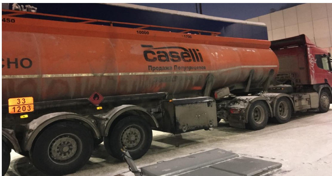
Рисунок 1 - Общий вид полуприцепа-цистерны Caselli DMD

Схема пломбировки от несанкционированного изменения положения указателя уровня налива, обозначение места нанесения знака поверки представлена на рисунке 2.