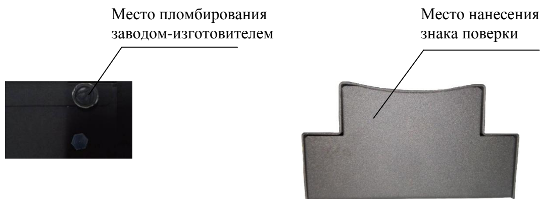
Рисунок 3 – Схема пломбировки от несанкционированного доступа, обозначение места нанесения знака поверки

Схема пломбировки от несанкционированного доступа, обозначение места нанесения знака поверки представлены на рисунке 3. Защита от внесения несанкционированных изменений в конструкцию ПЛК и модулей УВВ обеспечивается установкой пломбы завода-изготовителя на заднюю панель на винт крепления.