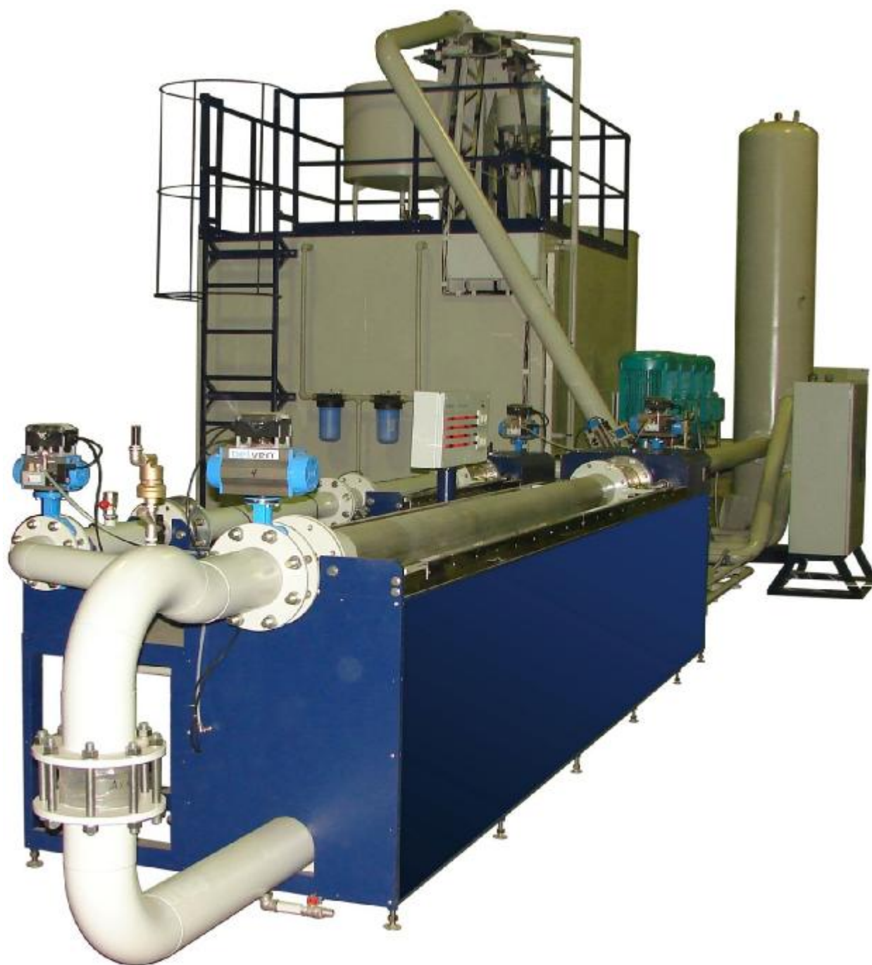
Рисунок 2 – Общий вид установок поверочных УПСЖ-ПРО

Пломбировка установок поверочных УПСЖ-ПРО осуществляется с помощью свинцовой (пластмассовой) пломбы и проволоки, которой пломбуются фланцевые соединения расходомеров установки, с нанесением знака поверки на пломбу и с помощью наклейки, которая клеится на оптодатчики (при их наличии) положения перегородки устройств переключения потока, с нанесением знака поверки на наклейку. Средства измерений условий окружающей и измеряемой среды пломбуются в соответствии с описанием типа на конкретное средство измерений. Места нанесения знака поверки на фланцевые соединения расходомеров и на оптодатчики положения перегородки устройств переключения потока (при их наличии) установок поверочных УПСЖ-ПРО приведены на рисунке 3.