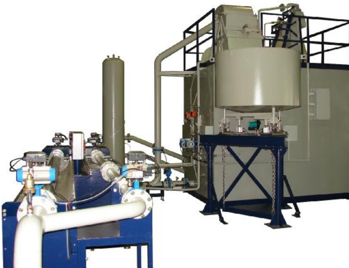
Рисунок 1 – Общий вид установок поверочных УПСЖ-ПРО

Общий вид установок поверочных УПСЖ-ПРО представлен на рисунке 1 и 2.