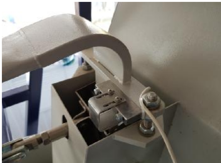
Рисунок 3 – Схема пломбировки от несанкционированного доступа, обозначение места нанесения знаков поверки на фланцевые соединения расходомеров и на оптодатчики положения перегородки устройства переключения потока (при их наличии) установок поверочных УПСЖ-ПРО