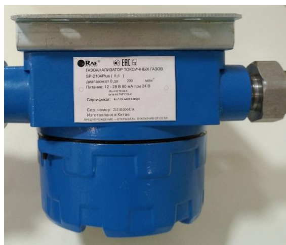
Рисунок 3 – Общий вид газоанализатора SP-2104 Plus