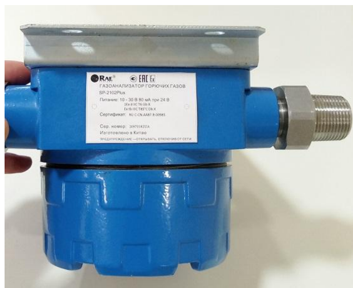
Рисунок 2 – Общий вид газоанализатора SP-2102 Plus