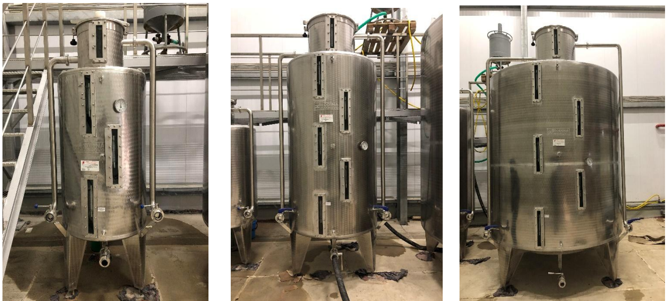
Рисунок 1 - Общий вид мерников металлических технических 1-го класса МТ, зав. №№ 18162, 18161, 18160

Общий вид мерников металлических технических 1-го класса МТ представлен на рисунке 1.