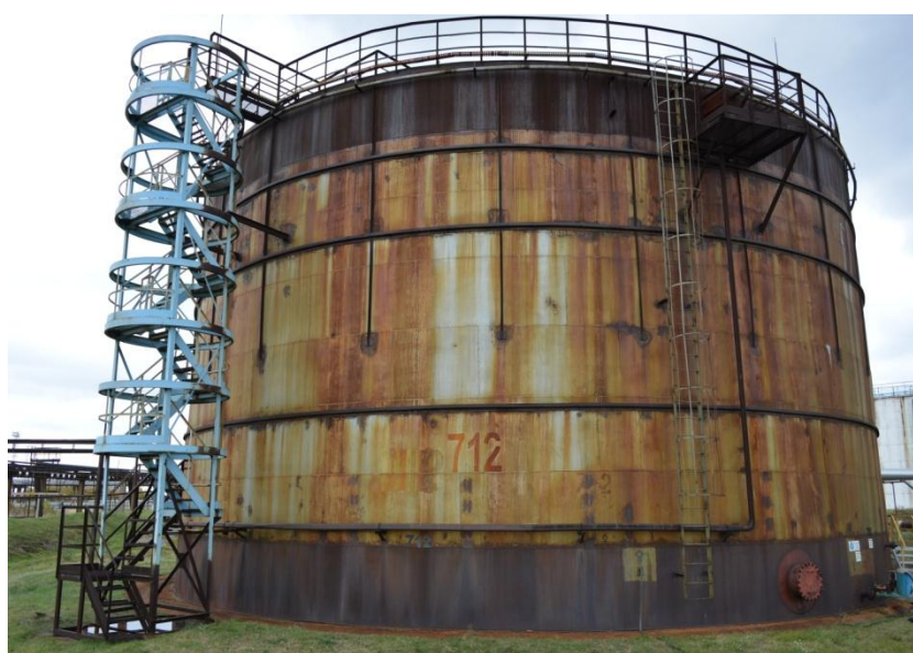
Рисунок 4 - Общий вид резервуара РВС-5000 № 712