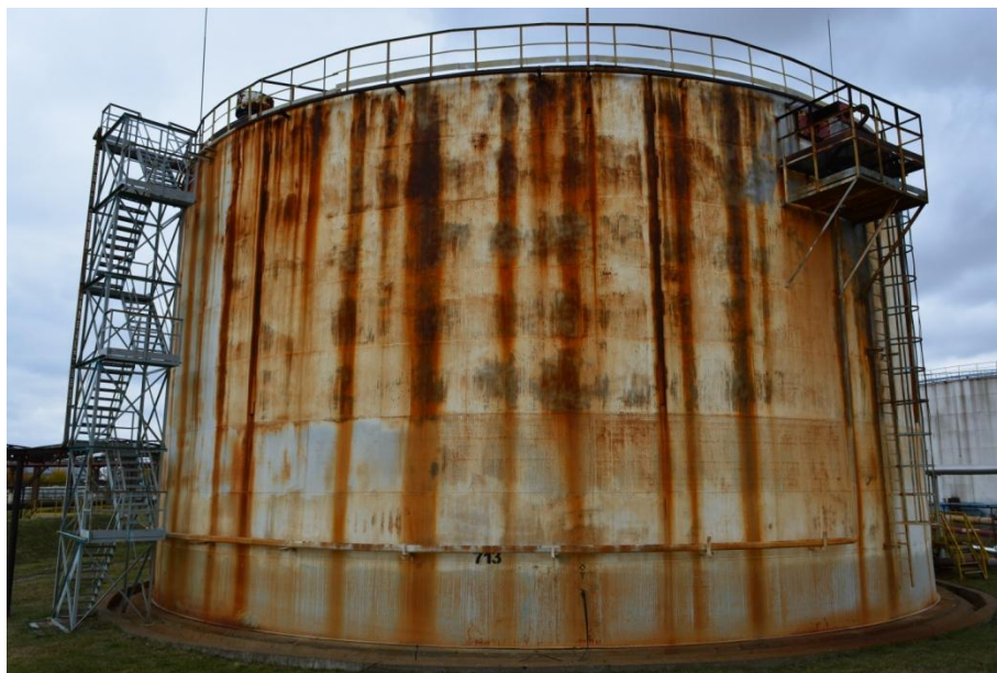
Рисунок 5 - Общий вид резервуара РВС-5000 № 713