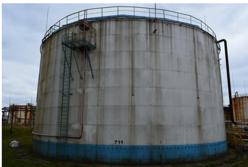
Рисунок 3 - Общий вид резервуара РВС-5000 № 711