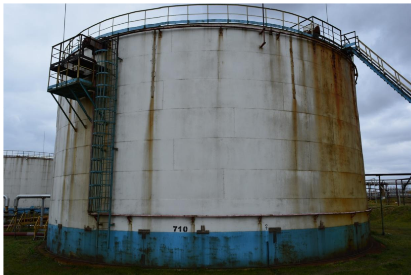
Рисунок 2 - Общий вид резервуара РВС-5000 № 710