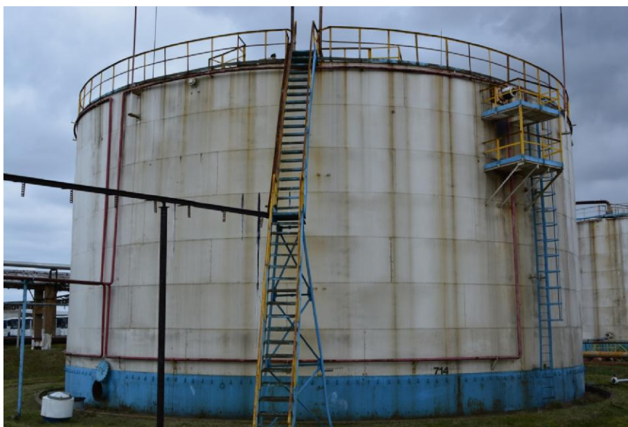
Рисунок 6 - Общий вид резервуара РВС-5000 № 714

Пломбирование резервуаров стальных вертикальных цилиндрических РВС-5000 не предусмотрено.