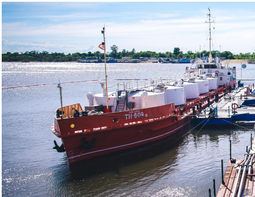
Рисунок 1 - Общий вид судна Сулук

Общий вид судна Сулук представлен на рисунке 1. Схема расположения резервуаров РВС-140 на палубе судна представлена на рисунке 2.