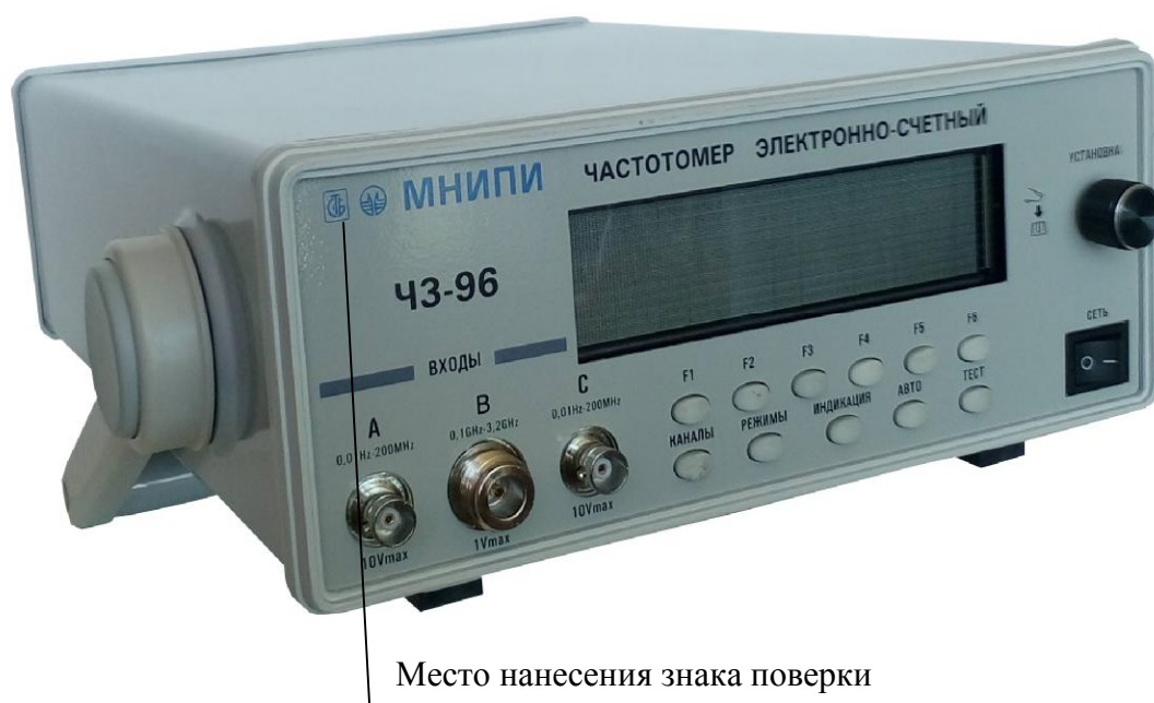
Рисунок 1 – Общий вид частотомера с указанием места для нанесения знака поверки