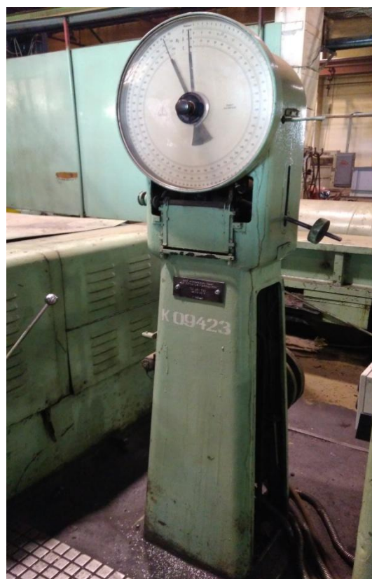
Рисунок 1 - Общий вид машины ЦМЛ-500