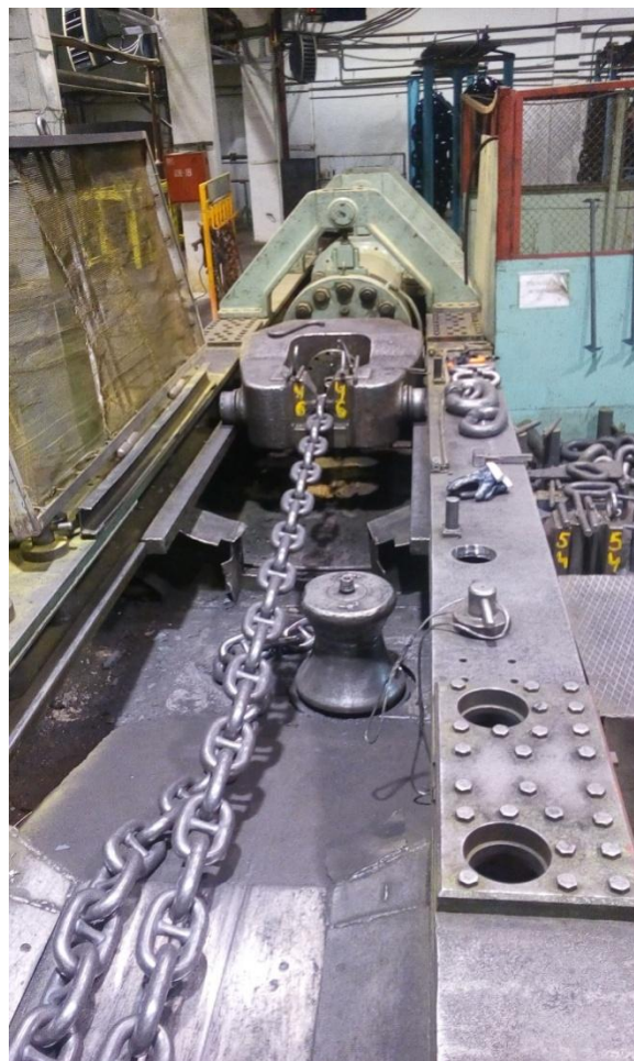
Рисунок 2 - Общий вид машины ЦМЛ-500