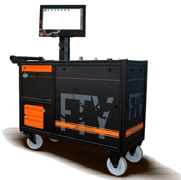
Рисунок 3 - Общий вид стендов для измерений крутящего момента силы серии FTY в чёрном исполнении