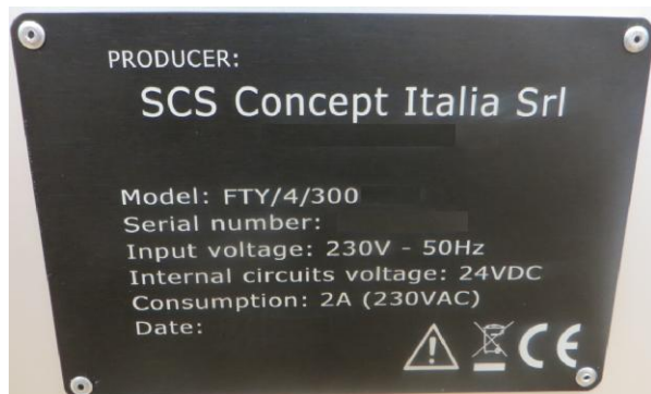
Рисунок 1 - Пример заводской таблички стендов

Общий вид стендов приведён на рисунках 3 - 4.