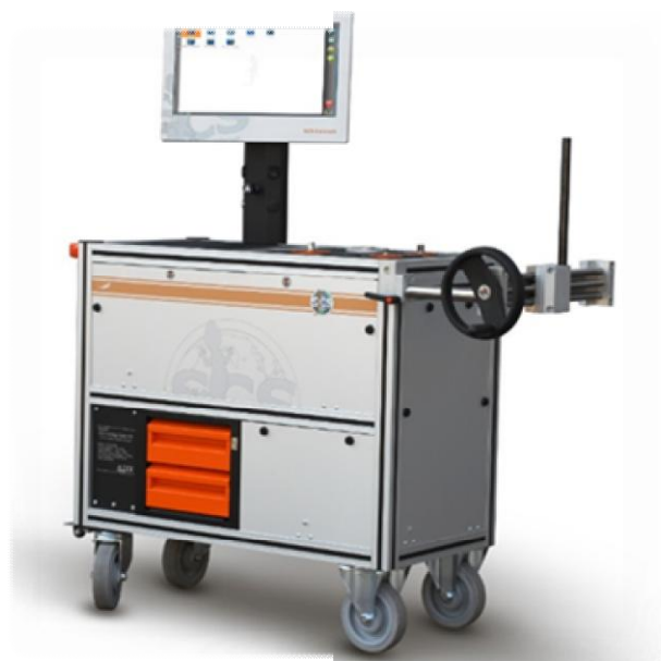
Рисунок 3 - Общий вид стендов для измерений крутящего момента силы серии FTY в сером исполнении