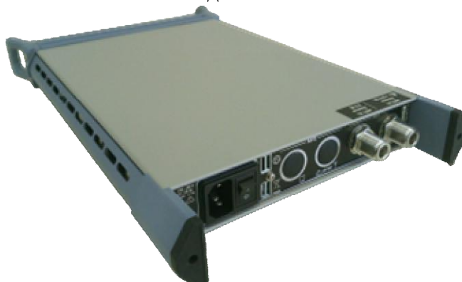
Рисунок 1б – Блок питания вид сзади