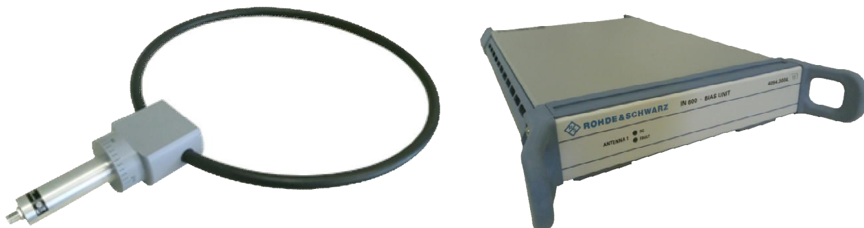
Рисунок 1а – Внешний вид антенны и блока питания

Место пломбировки от несанкционированного доступа, места нанесения знака утверждения типа и знака поверки представлены на рисунках 2а и 2б.