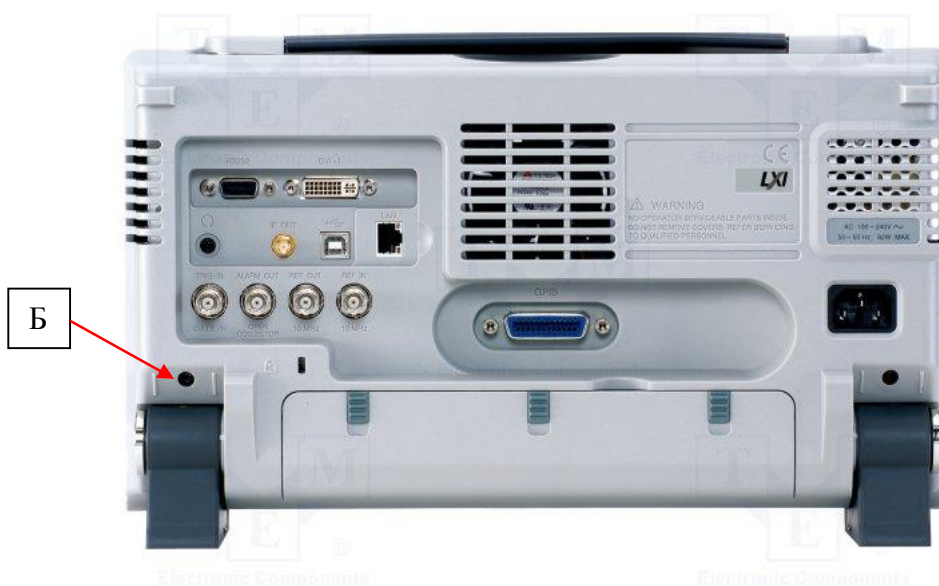
Рисунок 3 – Вид задней панели анализаторов и место пломбировки от несанкционированного доступа (Б)