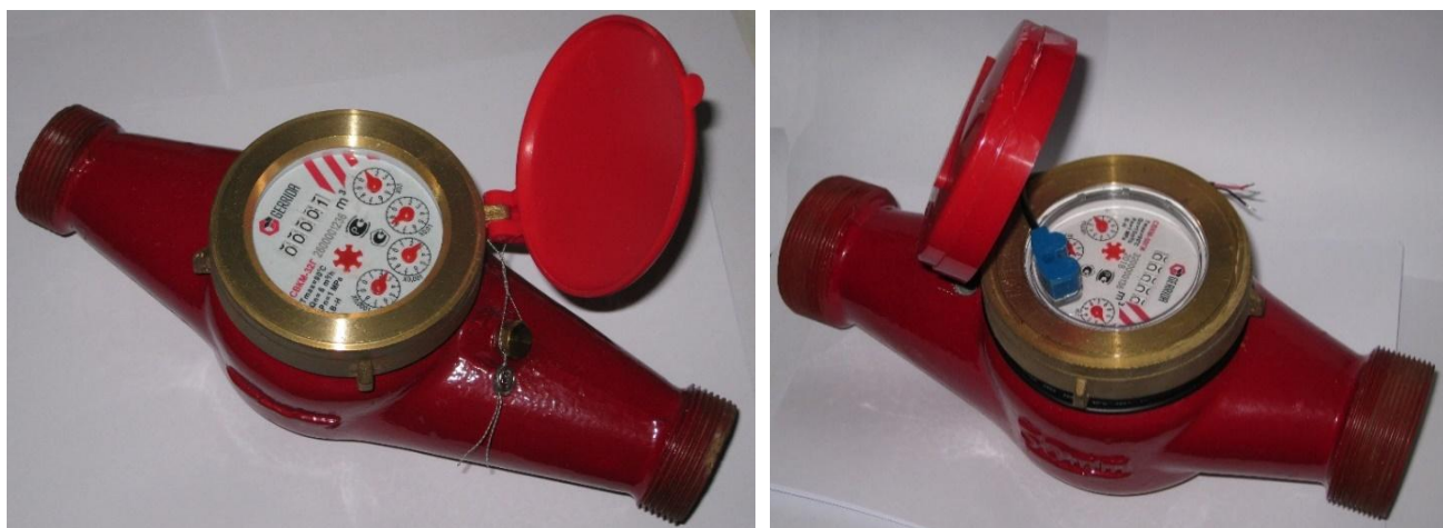
Рисунок 2 – Общий вид счетчиков воды крыльчатых СВКМ

Защита от несанкционированного доступа счетчиков воды крыльчатых СВК, СВКМ осуществляется в зависимости от исполнения корпуса одним из способов: