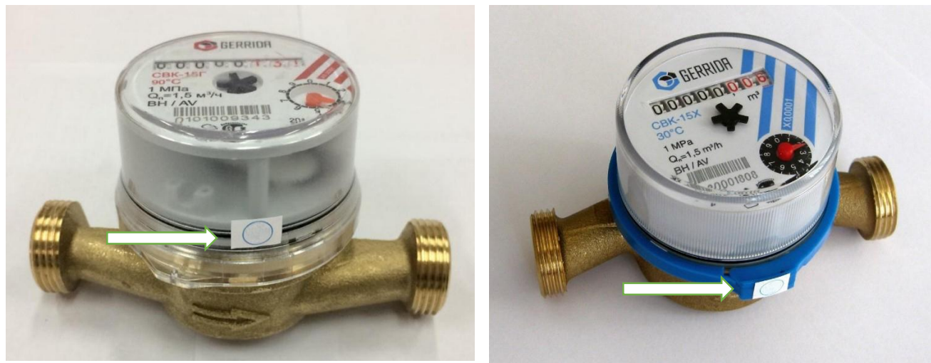
Рисунок 4 – Схема пломбировки от несанкционированного доступа, обозначение места нанесения знака поверки счетчиков воды крыльчатых СВК, СВКМ