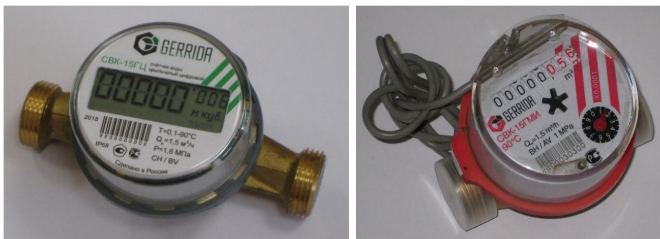
Рисунок 1 – Общий вид счетчиков воды крыльчатых СВК

Общий вид счетчиков воды крыльчатых СВК, СВКМ представлен на рисунках 1 и 2.