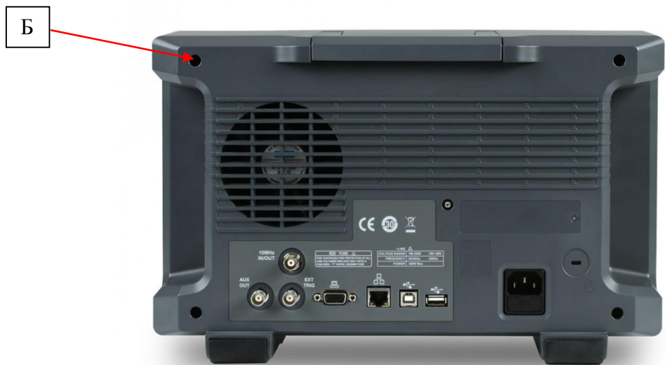
Рисунок 2 – Вид задней панели осциллографов и схема пломбировки от несанкционированного доступа (Б)

Программное обеспечение (ПО) осциллографов записано в памяти внутреннего контроллера и служит для управления режимами работы, выбора встроенных измерительных и вспомогательных функций.