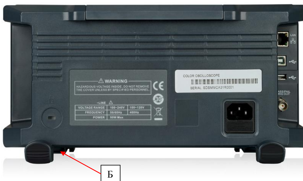
Рисунок 2 – Схема пломбировки от несанкционированного доступа (Б)