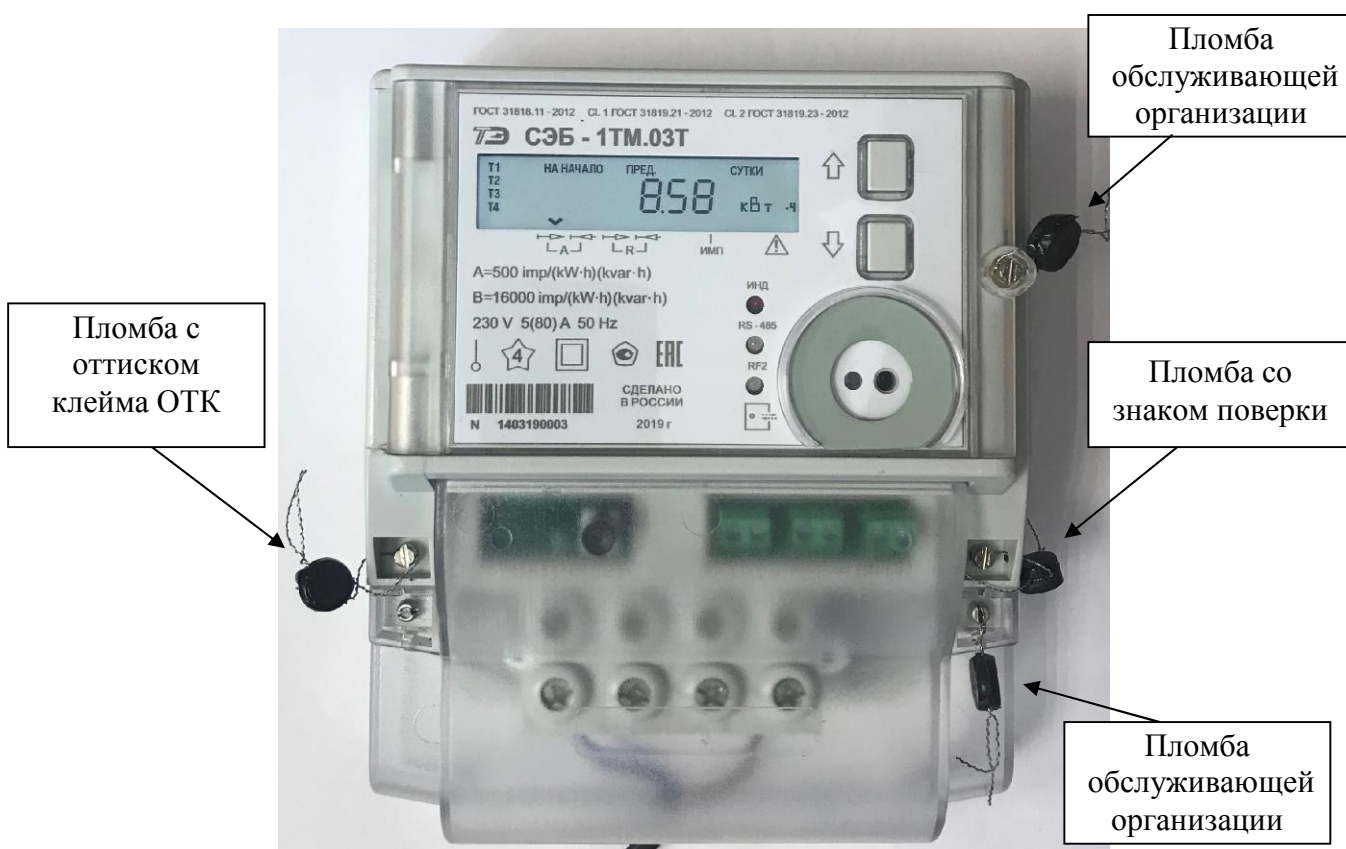
Рисунок 1 – Общий вид счетчика внутренней установки, схема пломбировки от несанкционированного доступа, обозначение места нанесения знака поверки

На рисунке 2 приведен внешний вид удаленного терминала, который может входить в состав комплекта поставки счетчиков наружной установки.