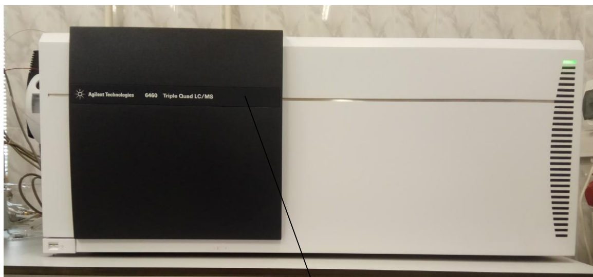
Место нанесения знака поверки