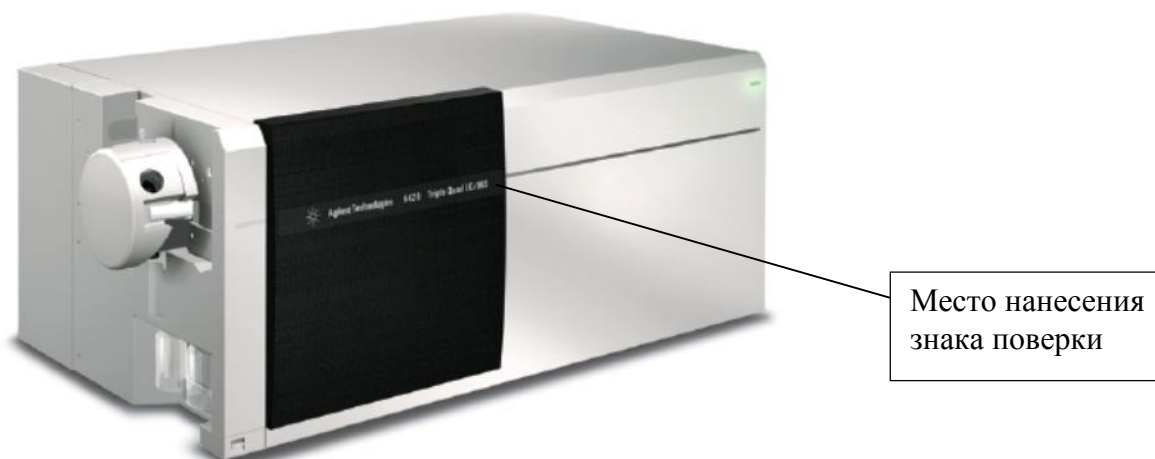
Рисунок 4 – Общий вид детекторов 6420 Triple Quad LC/MS 6420