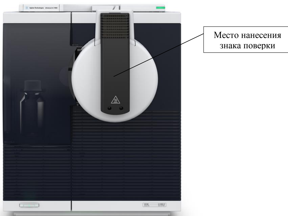
Рисунок 2 – Общий вид детекторов Infinity Lab LC/MSD