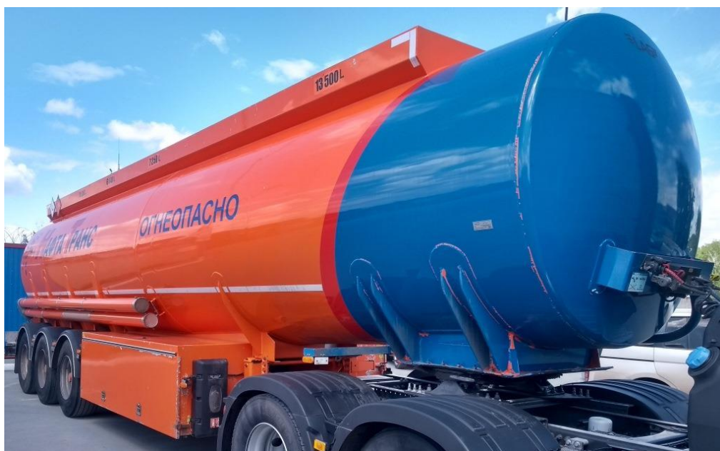
Рисунок 1 – Общий вид полуприцепа-цистерны LAG O-3-ST

Схема пломбировки для защиты от несанкционированного изменения положения указателя уровня налива, обозначение места нанесения знака поверки представлены на рисунке 2.