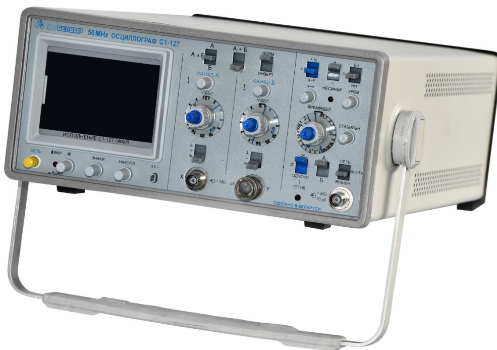
Рисунок 1 - Общий вид осциллографов С1-127 (ЖКИ)