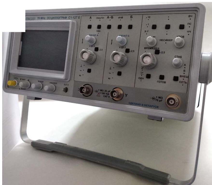
Рисунок 2 - Общий вид осциллографов С1-127 Е