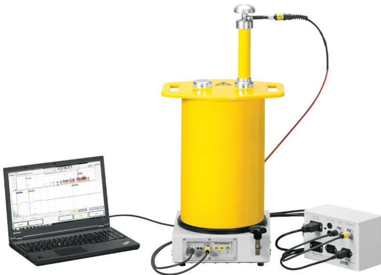
Рисунок 2 – Общий вид систем PD-TaD 80