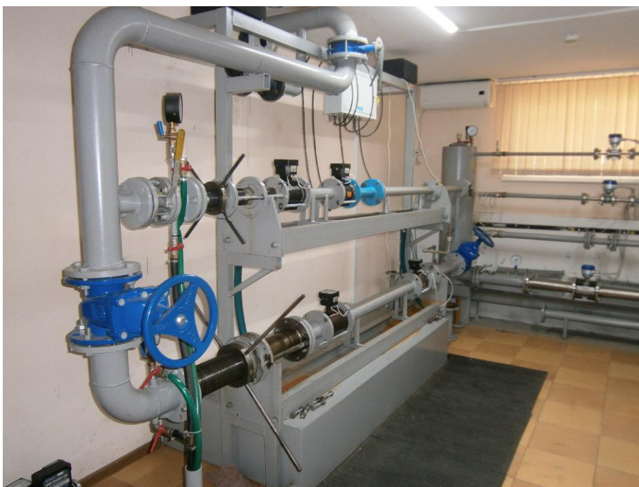
Рисунок 1 – Общий вид установки поверочной УПВ-140

Поверяемое средство измерений устанавливается в измерительную линию установки, состоящий из зажимного устройства, запорной арматуры, средств измерений давления и температуры измеряемой среды. Рабочая жидкость подается насосом из накопительного резервуара в гидравлический тракт рабочего контура установки, проходит через измерительную линию и средства измерений объемного расхода жидкости и объема жидкости установки. Далее рабочая жидкость направляется обратно в накопительный резервуар. Системы управления, сбора и обработки информации управляет работой установки, в автоматическом режиме собирает, обрабатывает и сравнивает полученные показания поверяемых средств измерений и средств измерений установки.