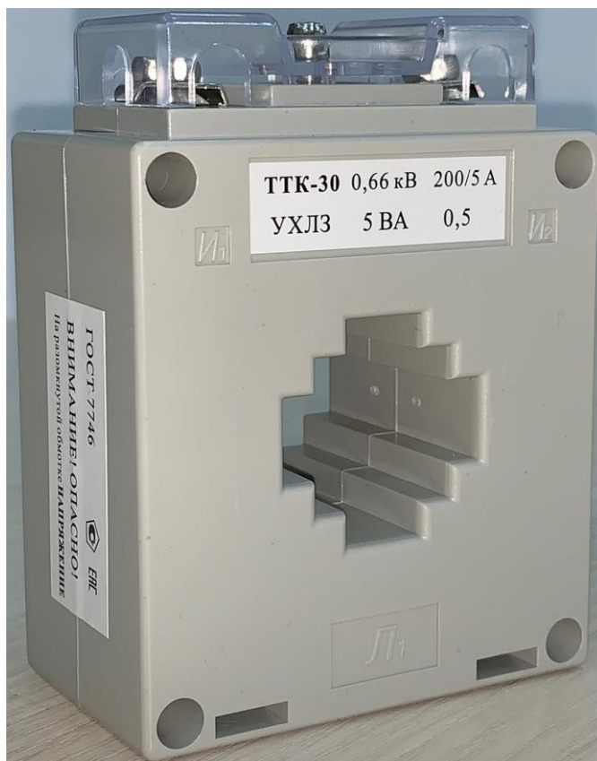
Рисунок 2 – Общий вид трансформаторов тока ТТК-30