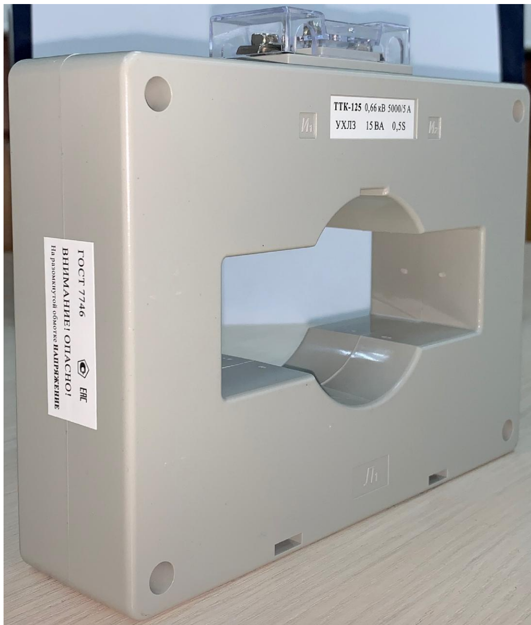
Рисунок 3 – Общий вид трансформаторов тока ТТК-125