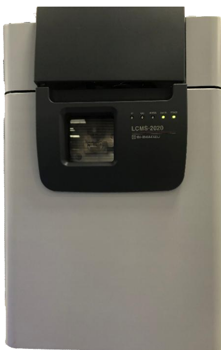
Рисунок 7 - Общий вид масс-спектрометрического детектора LCMS-2020