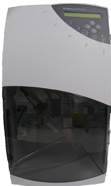
Рисунок 4 - Общий вид испарительного детектора светорассеяния ELSD-LT II