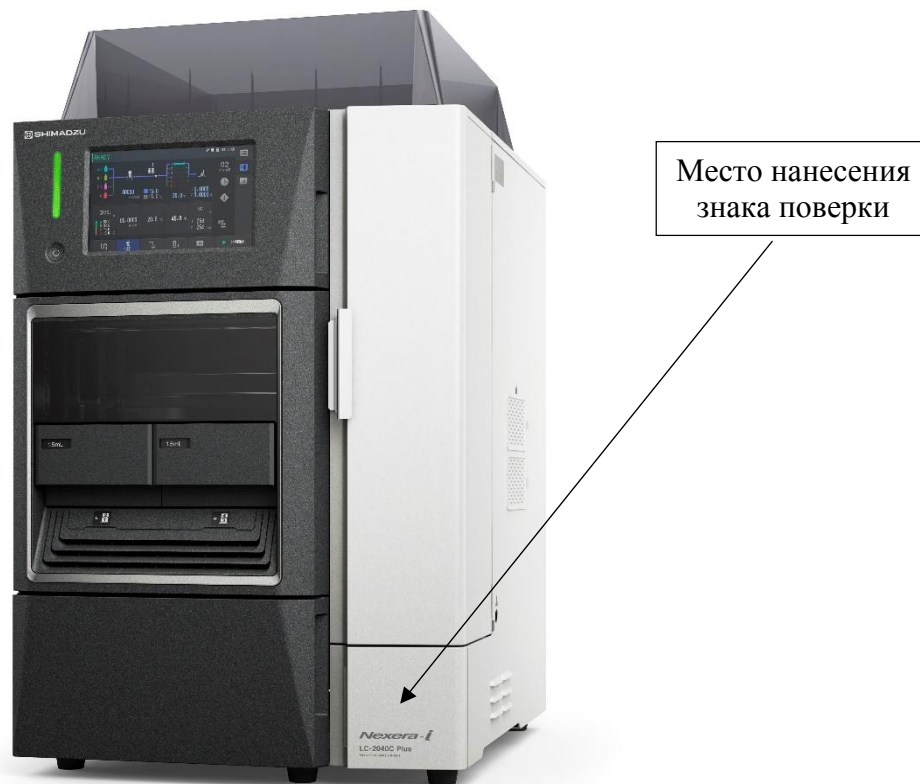
Рисунок 2 - Общий вид хроматографов жидкостных Nexera-i