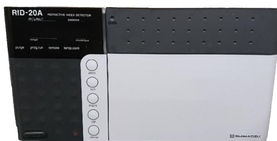
Рисунок 5 – Общий вид рефрактометрического детектора RID-20A