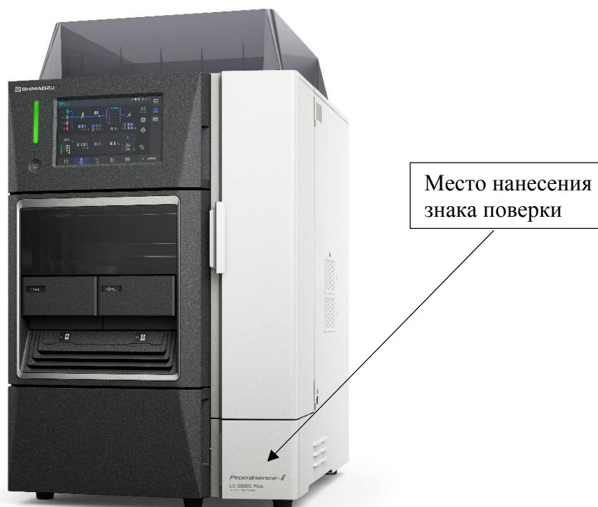
Рисунок 1 – Общий вид хроматографов жидкостных Prominence-i

Общий вид хроматографов и место нанесения знака поверки приведены на рис. 1 и 2, общий вид внешних детекторов приведены на рис. 3 - 7.