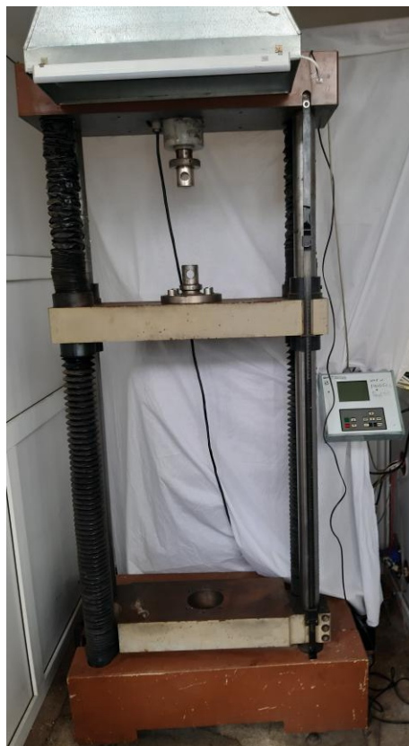
а) модуль силозадающий, пульт оператора