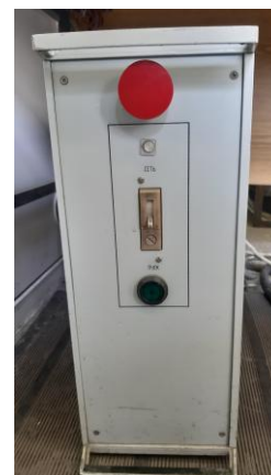
б) блок управления приводом