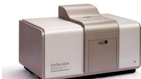
б) анализатор Bettersizer ST