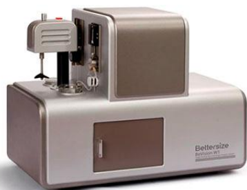
з) анализатор BeVision D1