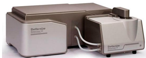
в) анализаторы Bettersizer S3, Bettersizer S3Plus