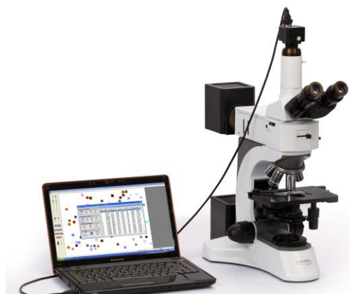
м) BeVision S1, BeVision M1