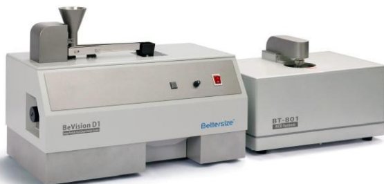
к) BeVision D2