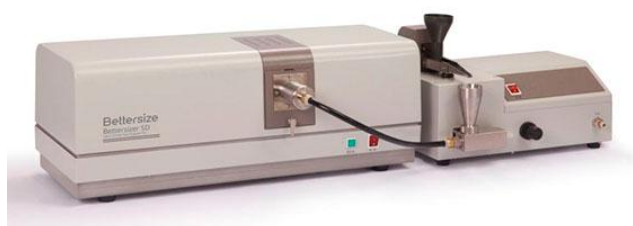
е) анализатор Bettersizer SD