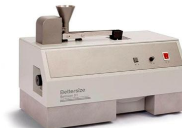
ж) анализатор BeVision D1