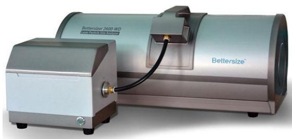
г) анализатор Bettersizer 2600