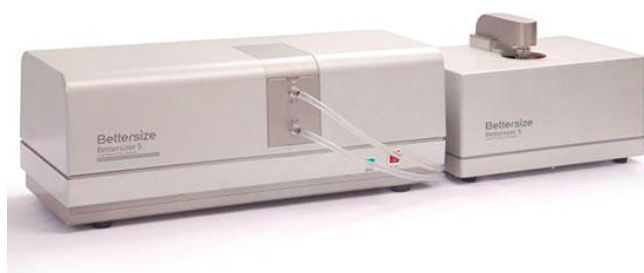
а) анализатор Bettersizer S

Внешний вид анализаторов приведен на рисунке 1. Пломбирования анализаторов не предусмотрено.