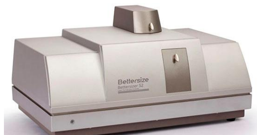
д) анализаторы Bettersizer S2, Bettersizer S2-G, Bettersizer S2-E