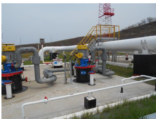
Рисунок 7 – Общий вид площадки размещения резервуара ЕП – 40 № 113