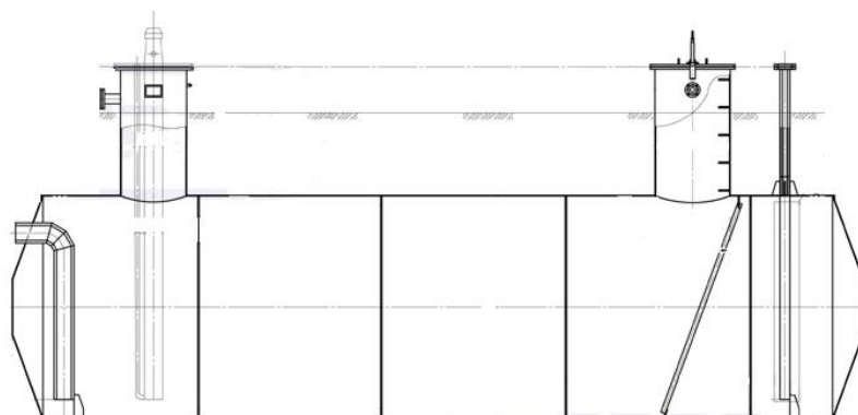
Рисунок 17 – Эскиз конструкции резервуаров ЕП – 40 №№ 109, 111, 113, 114, 154, 157, 158, 159, 173, 174