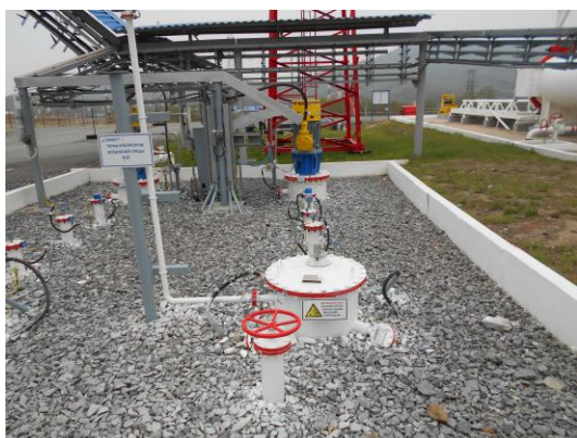
Рисунок 11 – Общий вид площадки размещения резервуаров ЕП – 40 № 173