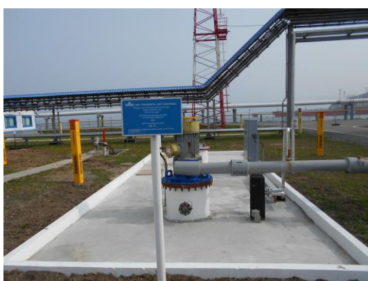
Рисунок 5 – Общий вид площадки размещения резервуара ЕП – 40 № 109