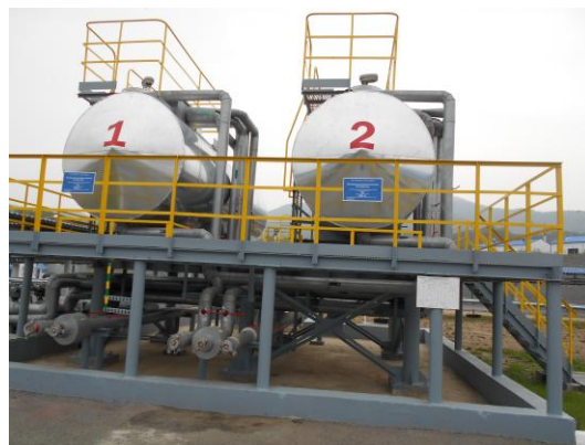
Рисунок 4 – Общий вид резервуаров РГС – 20 (3/17) №№ 193, 194