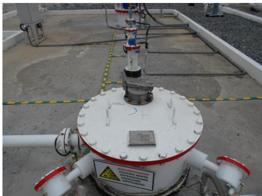
Рисунок 9 – Общий вид площадки размещения резервуара ЕП – 40 № 154