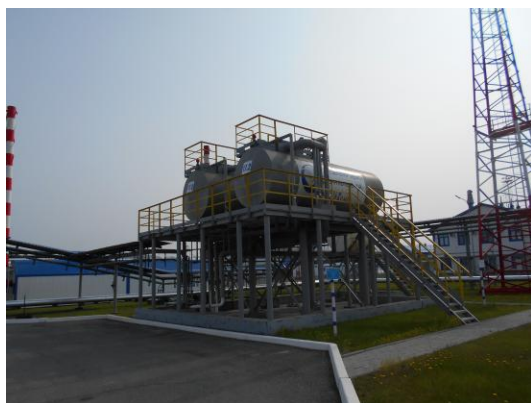
Рисунок 1 – Общий вид резервуаров РГС – 20 (3/17) №№ 151, 152

Общий вид резервуаров надземного размещения РГС – 20 (3/17) №№ 151, 152, 153, 154, 155, 187, 188, 189, 190, 193, 194 представлен на рисунках 1 – 4. Площадки резервуаров ЕП – 40 №№ 109, 111, 113, 114, 154, 157, 158, 159, 173, 174; ЕП – 25 №№ 26, 27, 39, 40; ЕП – 8 № 2 подземного размещения показаны на рисунках 5 – 16. Эскиз конструкции резервуаров подземного размещения, показан на рисунках 17 – 19.