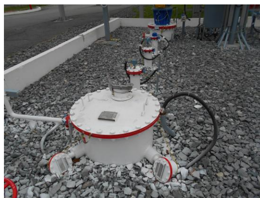
Рисунок 12 – Общий вид площадки размещения резервуара ЕП – 40 № 174