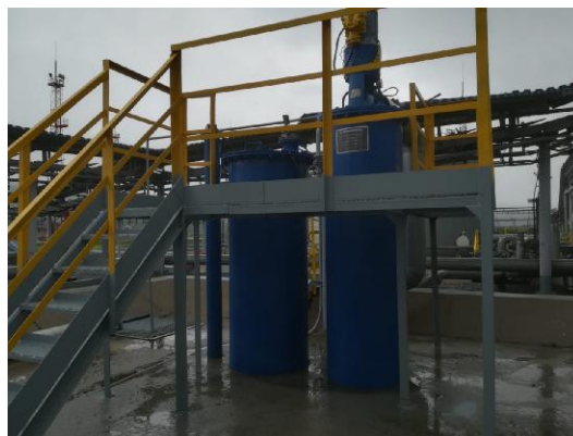
Рисунок 16 – Общий вид площадки размещения резервуара ЕП – 8 № 2