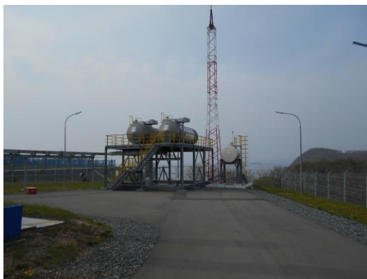
Рисунок 3 – Общий вид резервуаров РГС – 20 (3/17) №№ 189, 190