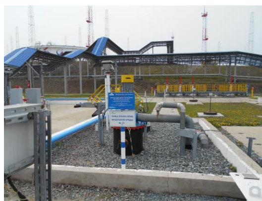
Рисунок 14 – Общий вид площадки размещения резервуаров ЕП – 25 № 27