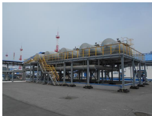
Рисунок 2 – Общий вид резервуаров РГС – 20 (3/17) №№ 153, 154, 155, 187, 188