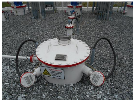
Рисунок 10 – Общий вид площадки размещения резервуаров ЕП – 40 №№ 157, 158, 159