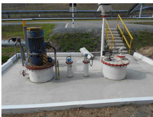
Рисунок 13 – Общий вид площадки размещения резервуаров ЕП – 25 № 26