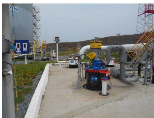
Рисунок 6 – Общий вид площадки размещения резервуара ЕП – 40 № 111