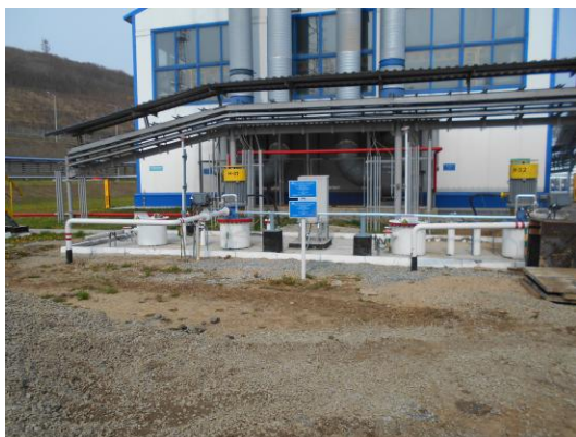
Рисунок 15 – Общий вид площадки размещения резервуаров ЕП – 25 №№ 39, 40