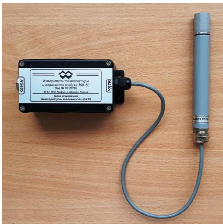
БИТВ с подключенным узлом датчиков температуры и влажности УДТВ