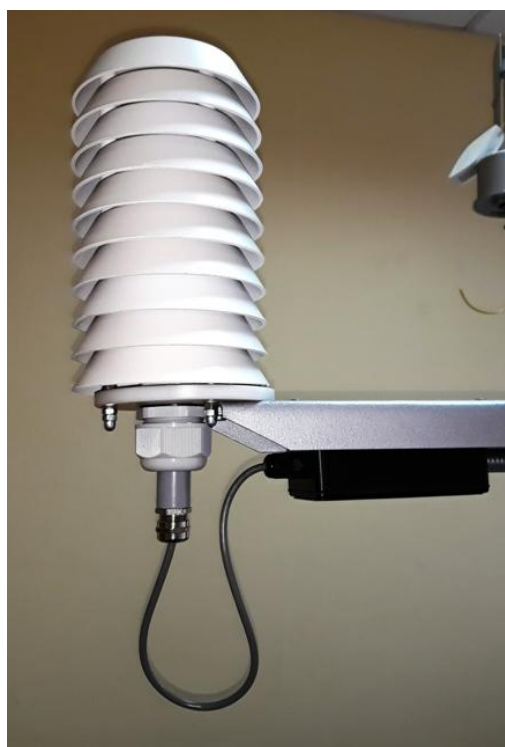
УДТВ в радиационной защите