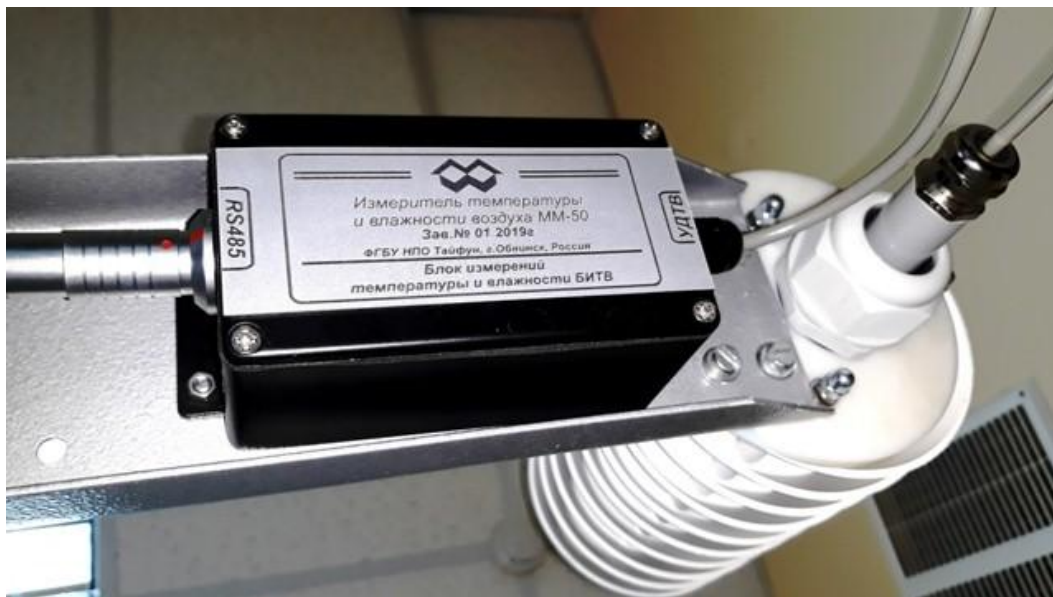
Блок измерения температуры и влажности воздуха BITV с узлом датчиков температуры и влажности УДТВ в радиационной защите