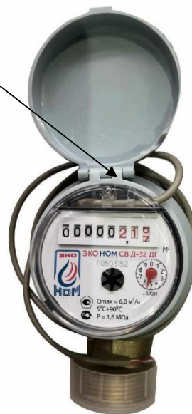
е) счетчики модификации ЭКО НОМ СВД-32 ДГ