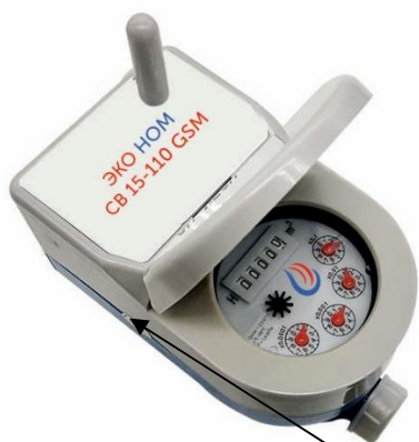
в) счетчики модификации ЭКО НОМ СВ 15-110 GSM