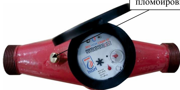
л) счетчики модификации ЭКО НОМ СВДМ-32