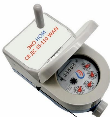
и) счетчики модификации ЭКО НОМ СВДС-15-110 WAN