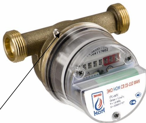
г) счетчики модификации ЭКО НОМ СВ 15-110 WAN