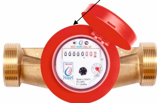
д) счетчики модификации ЭКО НОМ СВД-40