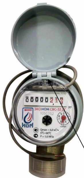
ж) счетчики модификации ЭКО НОМ СВС-32 ДГ