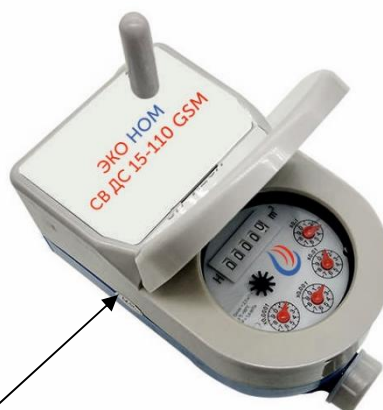
з) счетчики модификации ЭКО НОМ СВДС-15-110 GSM