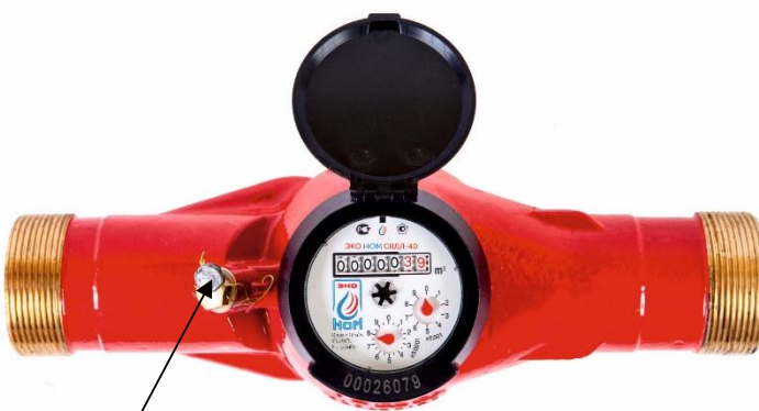
к) счетчики модификации ЭКО НОМ СВДЛ-40