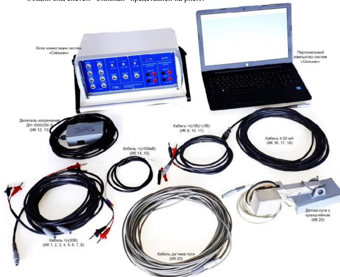
Рисунок 1 – Общий вид систем «Силькан»

Общий вид систем "Силькан" представлен на рис.1.