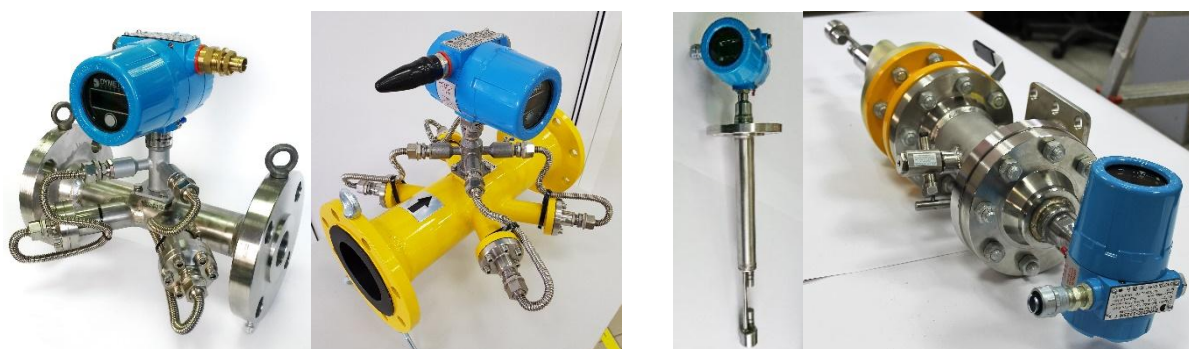
Рисунок 1 – Общий вид датчика базового исполнения

Корпус СИ пломбируется изготовителем. Пломба выглядит в виде заводской наклейки. Общий вид датчика базового исполнения представлен на рисунке 1.