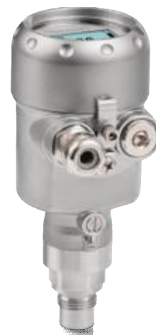
Рисунок 2 - Общий вид преобразователей ОПТИВАР РМ 5060