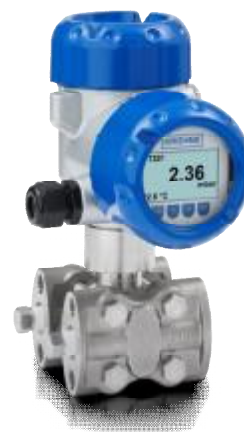
Рисунок 4- Общий вид преобразователей OPTIBAR DP 7060