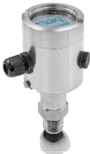
Рисунок 1- Общий вид преобразователей ОПТИВАР РМ 3050

Общий вид преобразователей представлен на рисунках 1-5, место нанесения пломбы представлено на рис.6 .