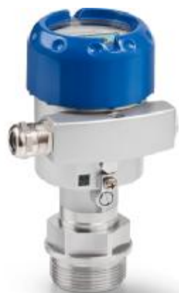
Рисунок 3- Общий вид преобразователей OPTIBAR PC 5060