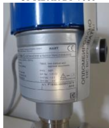
Рисунок 6 – Место нанесения пломбы на корпус преобразователя