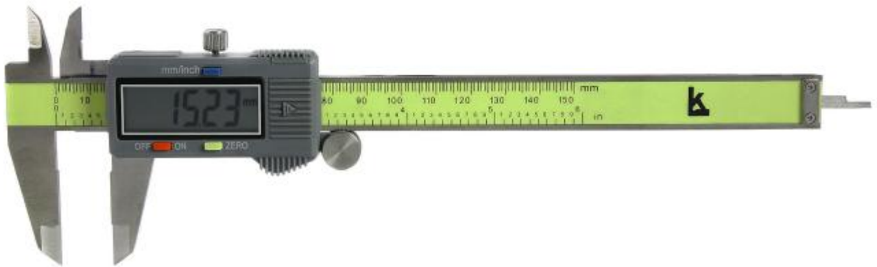
Рисунок 5 – Общий вид штангенциркулей модификации ШЦЦ-I