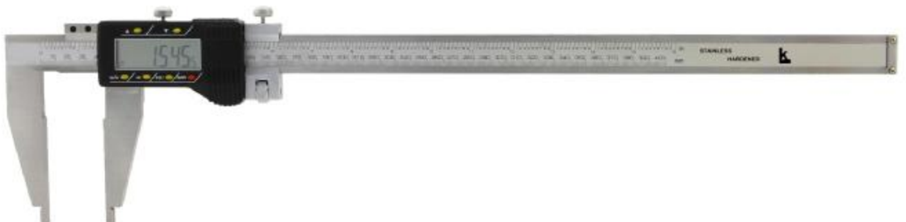
Рисунок 7 – Общий вид штангенциркулей модификации ШЦЦ-III