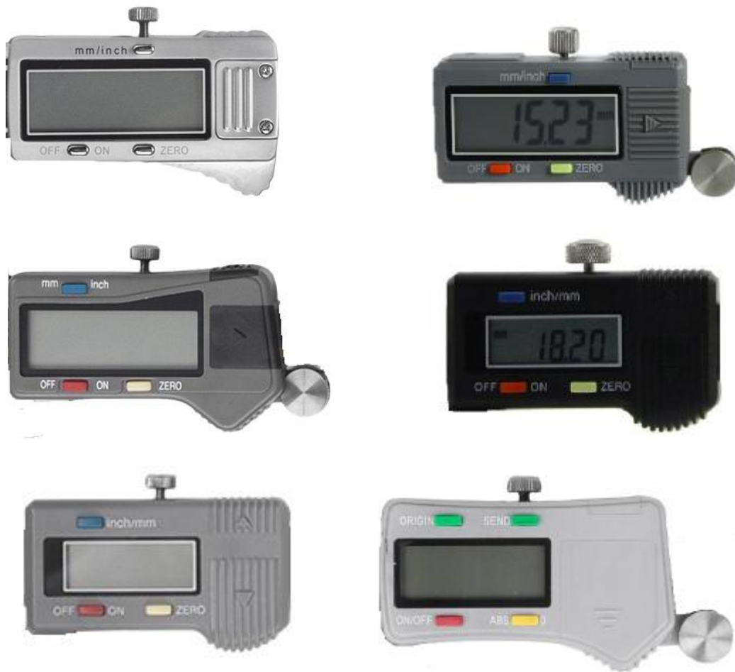
Рисунок 8 – Внешний вид корпуса цифрового отсчетного устройства