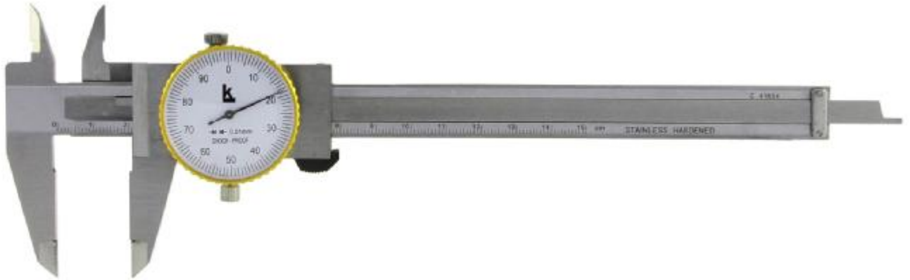
Рисунок 4 – Общий вид штангенциркулей модификации ШЦК-I