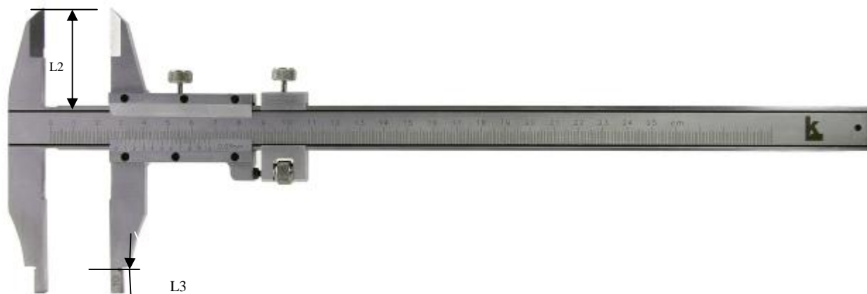
Рисунок 2 – Общий вид штангенциркулей модификации ЩЦ-II