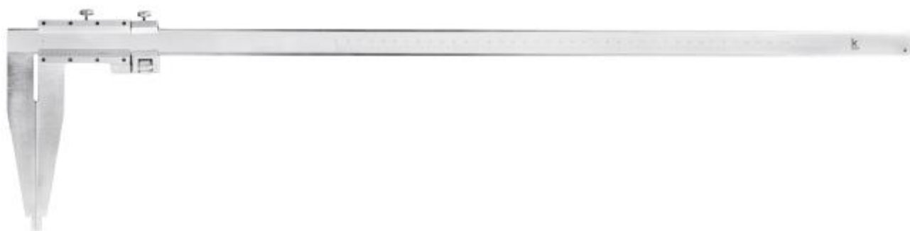
Рисунок 3 – Общий вид штангенциркулей модификации ЩЦ-III