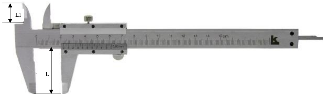
Рисунок 1 – Общий вид штангенциркулей модификации ЩЦ-I

К - Товарный знак «Калиброн» наносится на паспорт штангенциркулей типографским методом, на штангу и футляр штангенциркулей краской или методом лазерной маркировки.