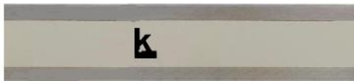
Рисунок 10 – Внешний вид штанги штангенциркулей ШЦЦ без оцифровки

Пломбирование корпуса штангенциркулей от несанкционированного доступа не предусмотрено.