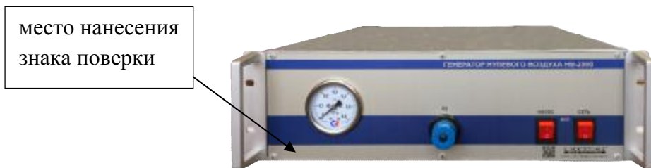
Рисунок 2 - Общий вид генератора мод. НВ-2000-2