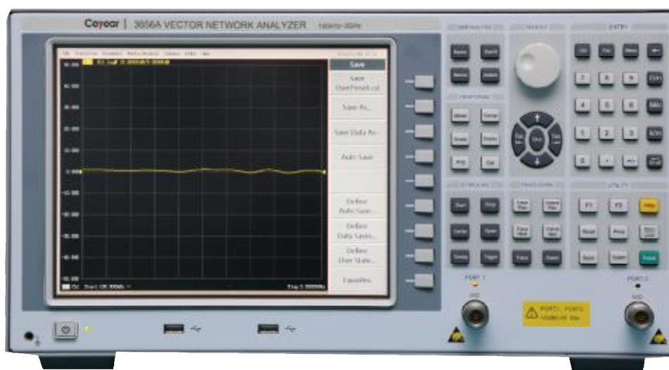
Рисунок 1 – Общий вид анализаторов. Вид спереди

Схема пломбировки от несанкционированного доступа представлена на рисунке 2.