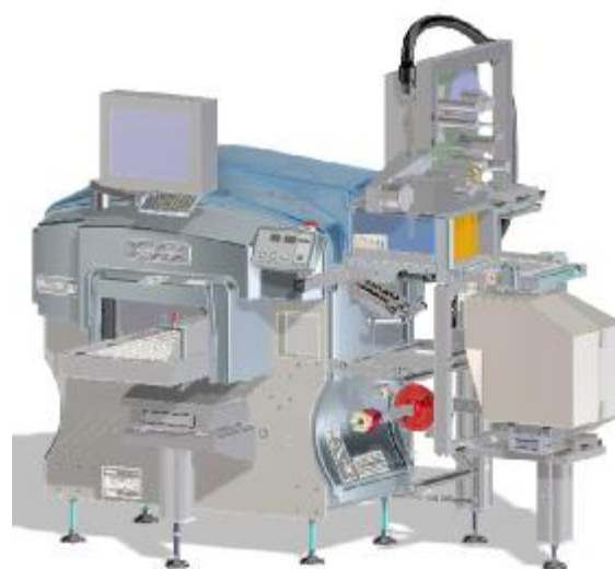
Б) АВУ на базе упаковочной машины ELIXA 30L LIBRA