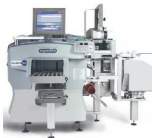
В) АВУ на базе упаковочной машины ELIXA 35 LIBRA