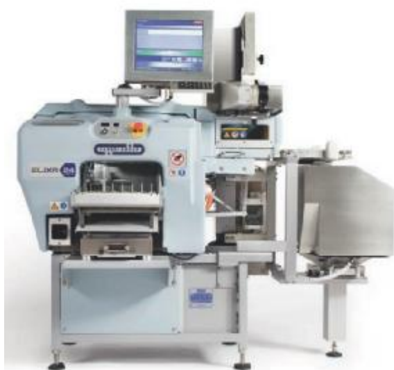
А) АВУ на базе упаковочной машины ELIXA 24 LIBRA

Схема пломбировки от несанкционированного доступа, обозначение места нанесения знака поверки представлены на рисунке 2.