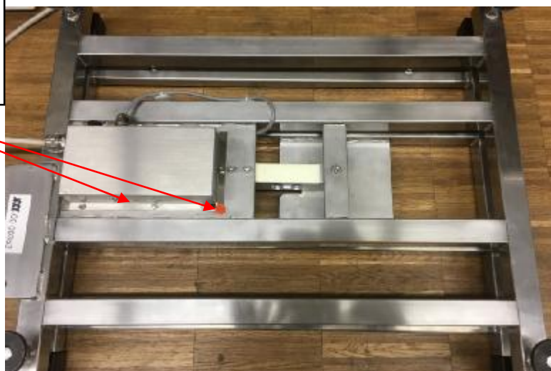
Рисунок 2 – Схема пломбировки от несанкционированного доступа, обозначение места нанесения знака поверки

Знаки поверки, ограничивающие доступ к переключателю юстировки