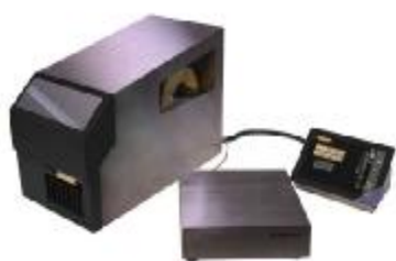
а) весы с выносным исполнением терминала без стойки