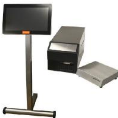
в) весы с выносным исполнением терминала на стойке