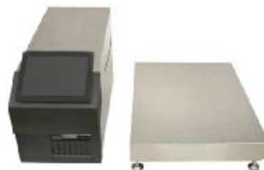
б) весы с исполнением терминала, объединённого с принтером в одном корпусе