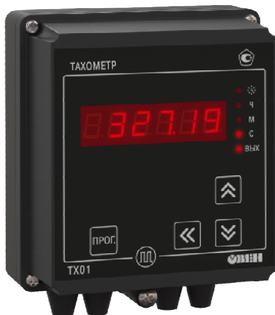
Рисунок 2 - Общий вид счетчиков в корпусе для настенного (Н) крепления

Общий вид счетчиков представлен на рисунках 2 и 3.