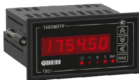
Рисунок 3 - Общий вид счетчиков в корпусе для щитового (Щ2) крепления

Пломбирование счетчиков не предусмотрено.