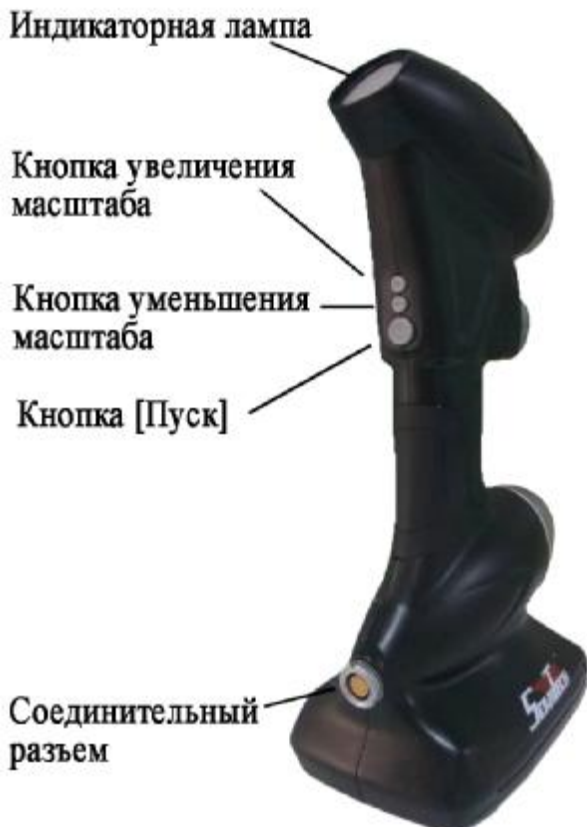
Рисунок 4 - Общий вид приборов с тыльной стороны