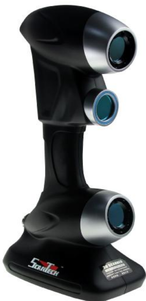
Рисунок 2 - Общий прибор оптических координатно-измерительных бесконтактных серии HSCAN