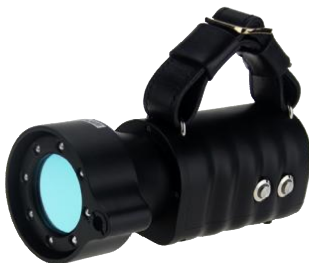
Рисунок 1 - Общий вид прибора оптического координатно-измерительного фотограмметрического MSCAN