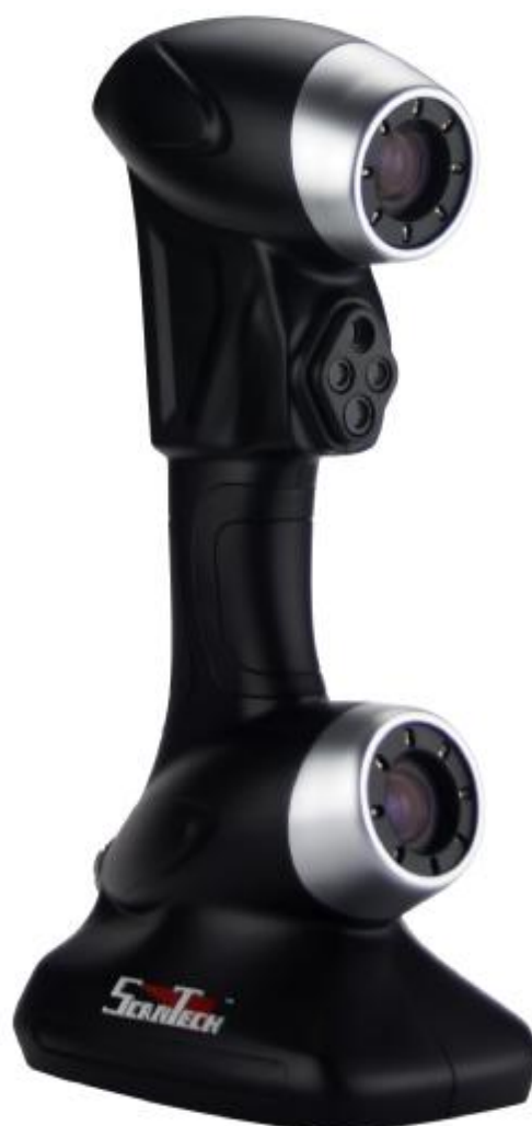
Рисунок 3 - Общий прибор оптических координатно-измерительных бесконтактных серии PRINCE