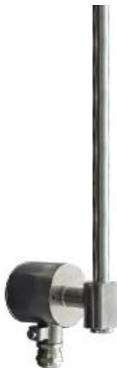
Преобразователь модификации ПРМ с показывающим устройством