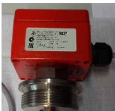
Маркировочная табличка преобразователей без показывающего устройства