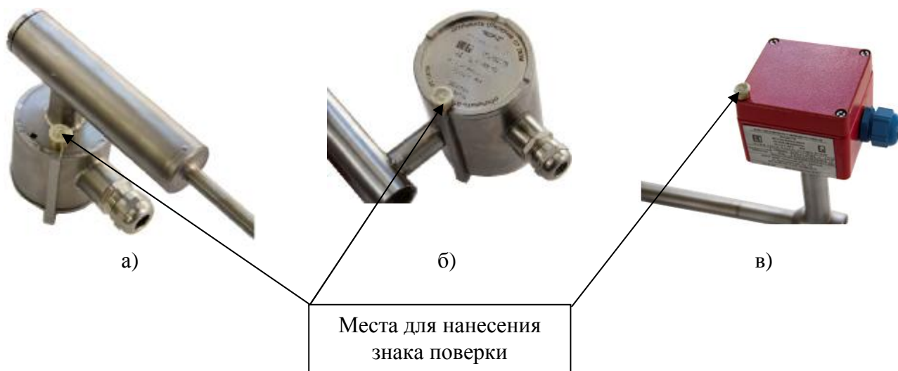
Рисунок 3 – Схема пломбировки от несанкционированного доступа, обозначение мест нанесения знака поверки