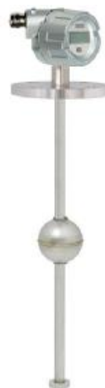
Преобразователь модификации ПРМ-П с показывающим устройством