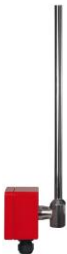
Преобразователь модификации ПРМ без показывающего устройства