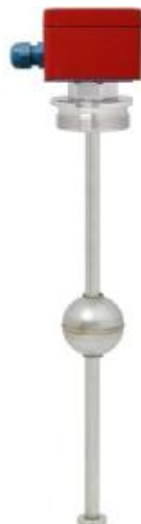
Преобразователь модификации ПРМ-П без показывающего устройства