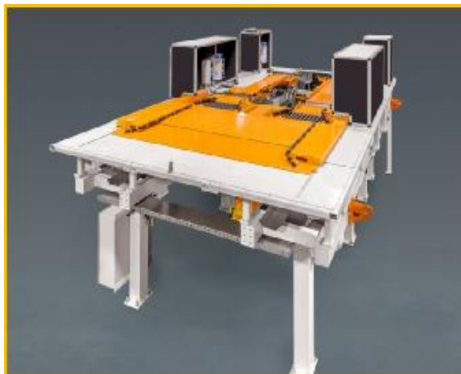
Рисунок 1 - Общий вид стенов для регулировки углов установки колес автомобилей, модель NCA