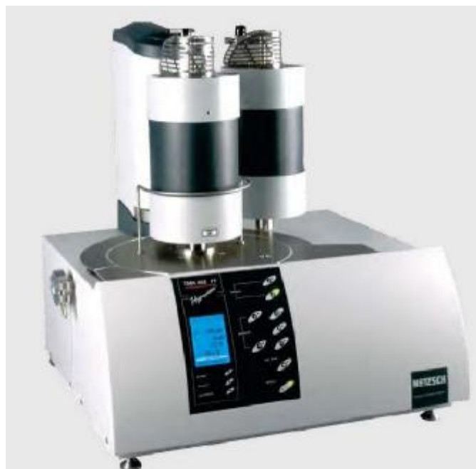
Рисунок 1 – Общий вид измерительного блока анализаторов термомеханических ТМА 402