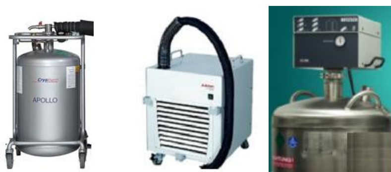
Рисунок 2 – Общий вид различных охлаждающих устройств