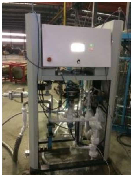
Рисунок 1 – Общий вид колонки