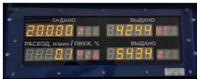
Рисунок 7 – Табло информационное (ТИ-01)

Места нанесения клейм (наклеек и пломб) на составные части системы изображены на рисунках 8 – 11.