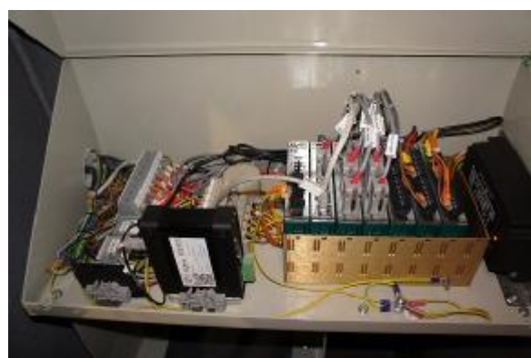
Рисунок 4 – БСК-01 без защитной крышки