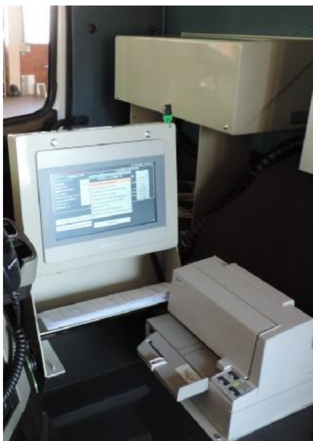
Рисунок 3 – Общий вид составных частей системы (БСК-01 с закрытой защитной крышкой, ТОС-01, принтер) в кабине средства заправки