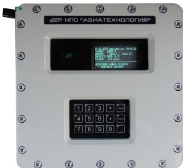
Рисунок 6 – Пульта управления специальным контроллером (ПУСК-01)