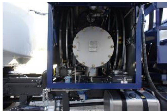
Рисунок 2 – Общий вид системы сзади на средстве заправки