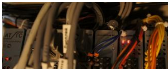
Рисунок 8 – Пломбирование платы аналогового входа контроллера