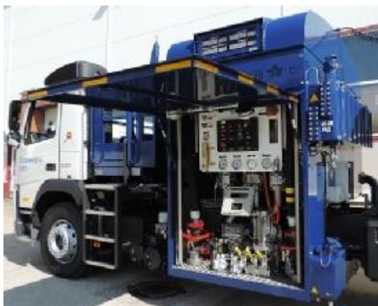
Рисунок 1 – Общий вид системы спереди на средстве заправки