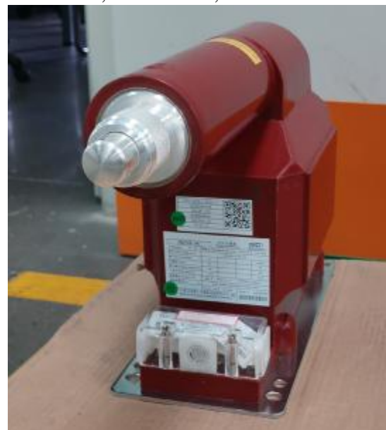
в) модификации JDZXR-3C, JDZXR-6C, JDZXR-10C