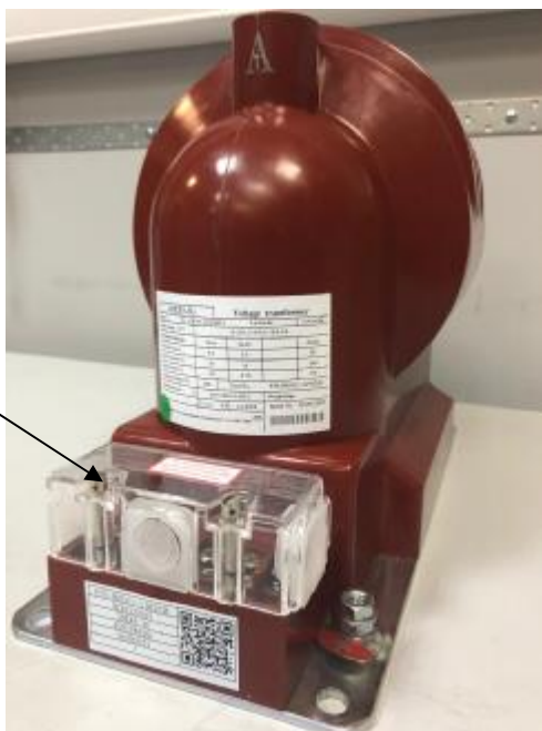
а) модификации JDZ9-3, JDZ9-6, JDZ9-10, JDZX9-3G, JDZX9-6G, JDZX9-10G