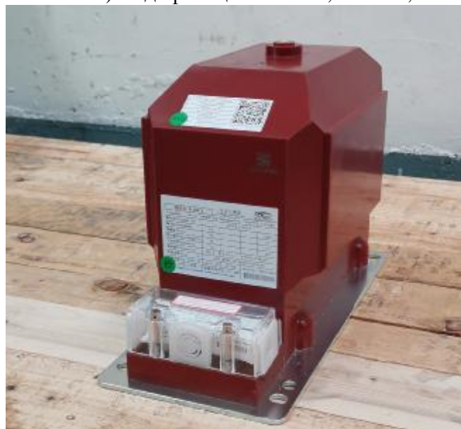
б) модификации JDZX10-3C1, JDZX10-6C1, JDZX10-10C1