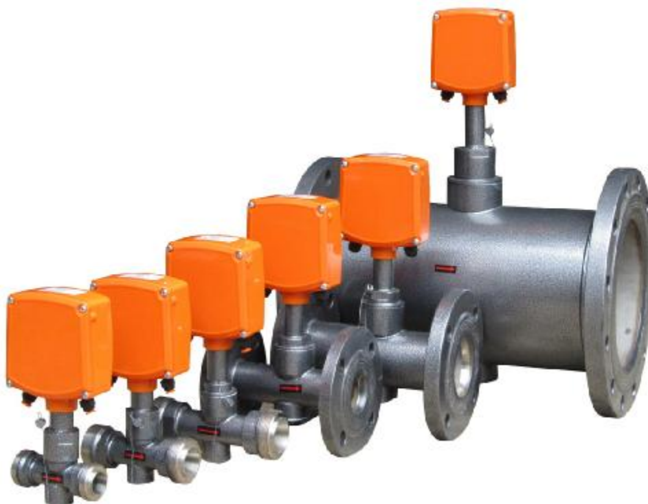
Рисунок 1 – Общий вид преобразователей расхода вихревых ВПС

Общий вид преобразователей расхода вихревых ВПС представлен на рисунке 1.