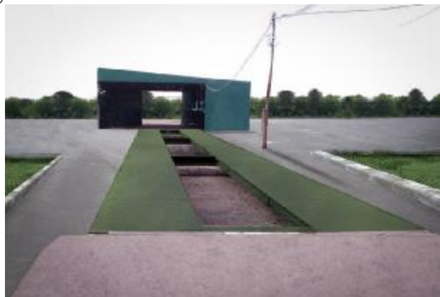
Рисунок 1 – Общий вид ГПУ весов (примеры)

Модификации весов имеют обозначения вида Талант-[1]-[2]-[3]-[4]-[5]-[6]. Расшифровка индексов в обозначении модификаций приведена в таблице 1.