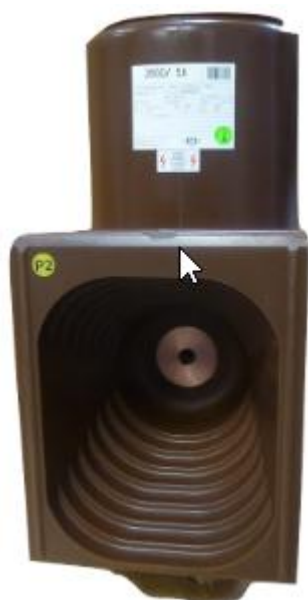
Рисунок 3 – Общий вид трансформаторов модификаций ASW 12, ASW 12 Gr. XX