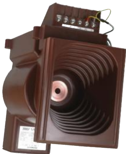
Рисунок 5 – Общий вид трансформаторов модификации ASX 24, ASX 24 Gr. XX