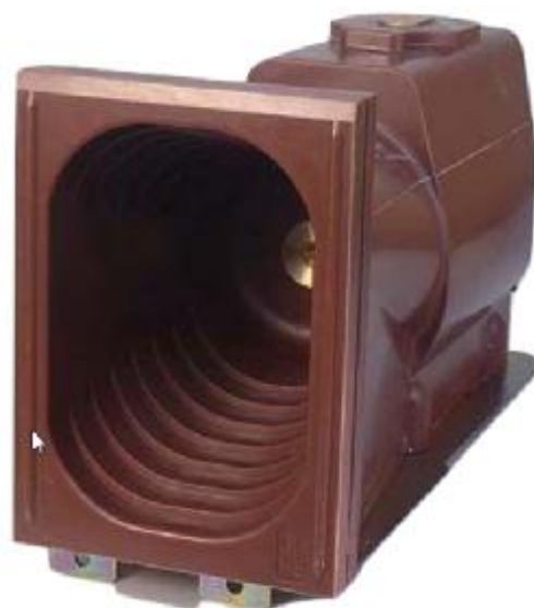
Рисунок 4 – Общий вид трансформаторов модификаций ASX 12, ASX 12 Gr. XX