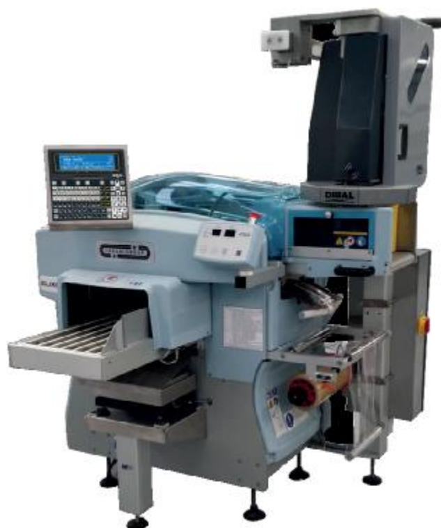
WL4000 (в составе упаковочной машины)