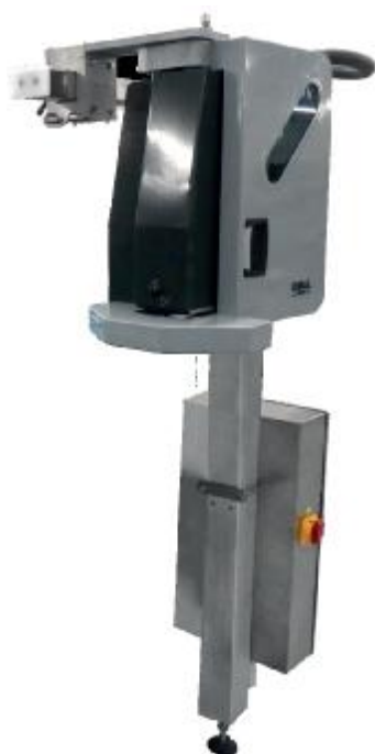
Печатающее устройство и электрический шкаф