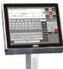
терминал с сенсорным экраном