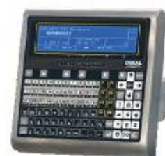
устройство обработки измерительной информации с показывающим устройством и клавиатурой управления