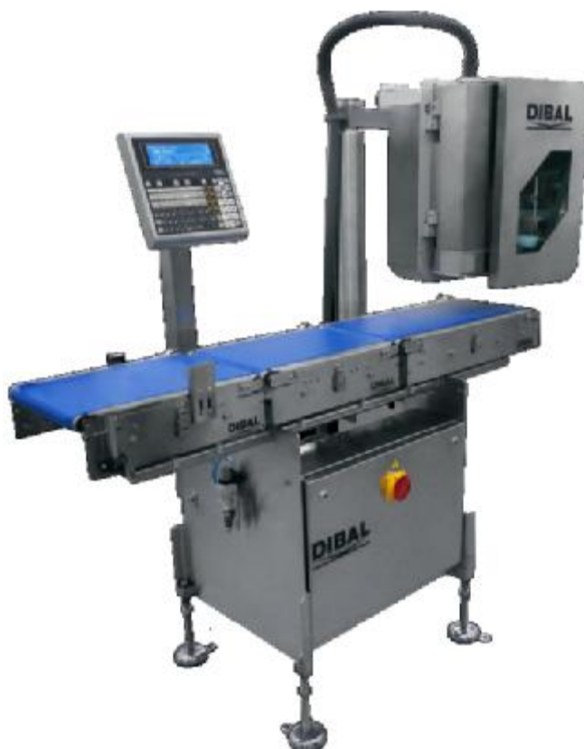
LS4000 (исполнение в качестве устройства для этикетирования массы)

Общий вид средства измерений и дополнительного терминала представлен на рисунках 1 и 2.