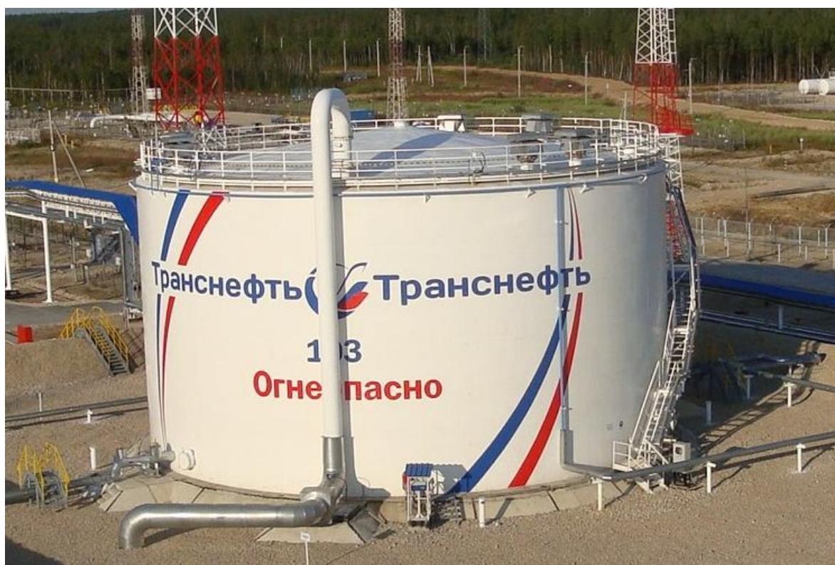
Рисунок 2 – Общий вид резервуара РВС-5000 зав.№ 103

Пломбирование резервуаров вертикальных стальных цилиндрических РВС-3000, РВС-5000 не предусмотрено.