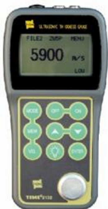
Рисунок 7 – Внешний вид толщиномеров ультразвуковых TIME2132