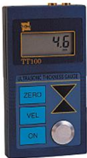
Рисунок 1 – Внешний вид толщиномеров ультразвуковых TT100