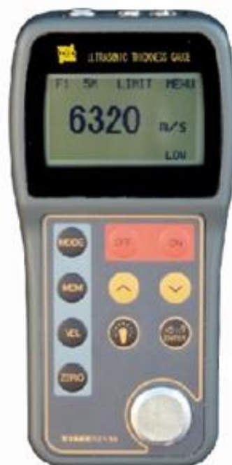
Рисунок 6 – Внешний вид толщиномеров ультразвуковых TIME2130