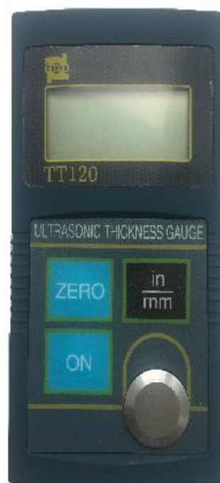
Рисунок 2 – Внешний вид толщиномеров ультразвуковых TT120