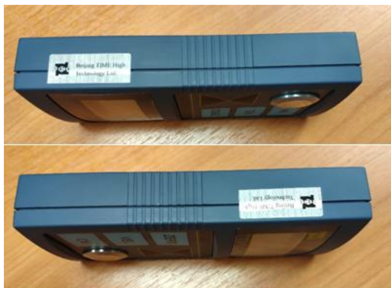
Рисунок 8 – Схема пломбировки от несанкционированного доступа

Для ограничения доступа к определенным частям в целях несанкционированной настройки и вмешательства производится пломбирование на боковых сторонах толщиномеров. Схема пломбировки от несанкционированного доступа приведена на рисунке 8.