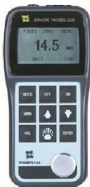
Рисунок 8 – Внешний вид толщиномеров ультразвуковых TIME2134