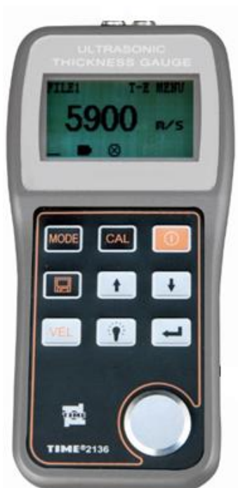
Рисунок 9 – Внешний вид толщиномеров ультразвуковых TIME2136