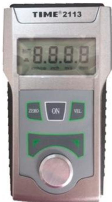
Рисунок 5 – Внешний вид толщиномеров ультразвуковых TIME2113