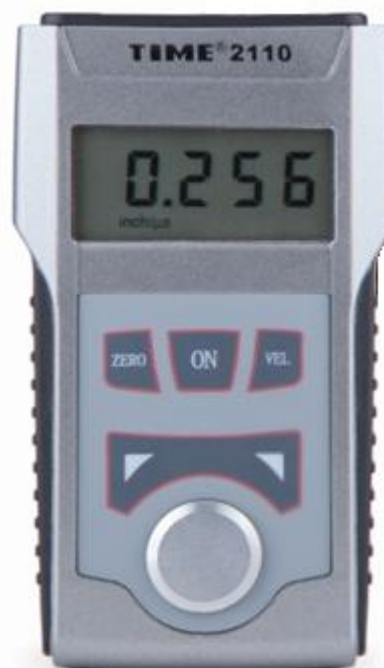
Рисунок 4 – Внешний вид толщиномеров ультразвуковых TIME2110