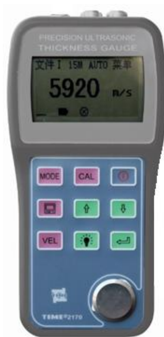
Рисунок 10 – Внешний вид толщиномеров ультразвуковых TIME2170

Для ограничения доступа к определенным частям в целях несанкционированной настройки и вмешательства производится пломбирование на боковых сторонах толщиномеров. Схема пломбировки от несанкционированного доступа приведена на рисунке 8.